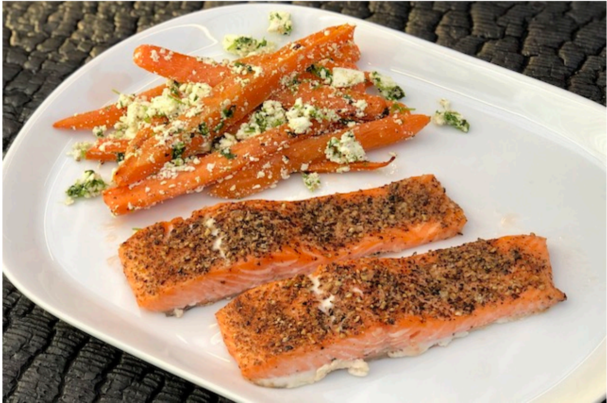
Varmrøget laks på cedertræplanke