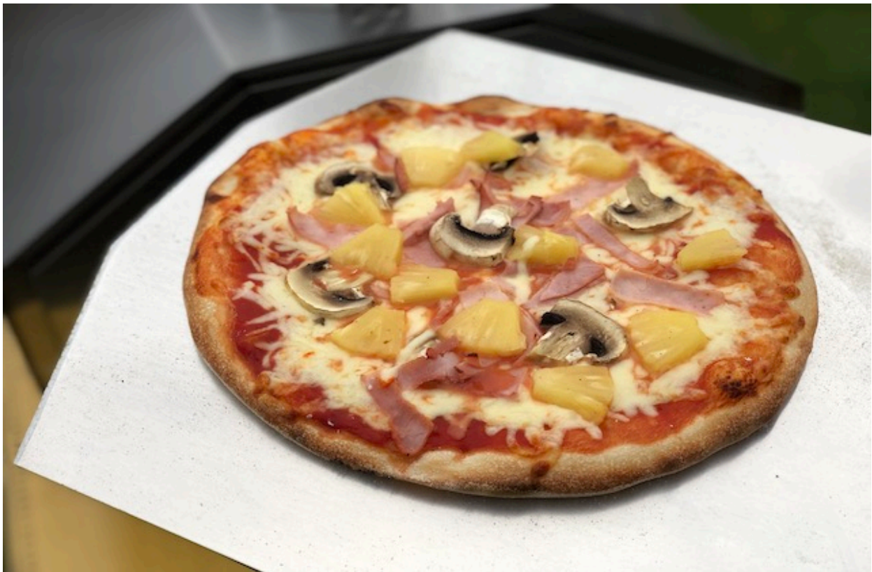
Pizza færdig efter 2 minutter lavet i Uuni Pro

Hvis du leder efter en premium klasse Pizzaovn, af høj kvalitet som også skal være alsidig, vil du ikke finde en meget bedre Pizzaovn end denne Uuni Pro udendørs ovn. Den leverer fantastiske resultater og er meget alsidig, der desværre ikke helt er i overensstemmelse med dennes ret høje pris. Men når det er sagt så syntes jeg at Uuni Pro har mange fordele i henhold til dens lillebror Uuni3. Og ja je vil vælge Uuni Pro i forhold til Uuni 3 igen fordi den har den der meget store bageareal som fordeler varmen fantastisk godt.