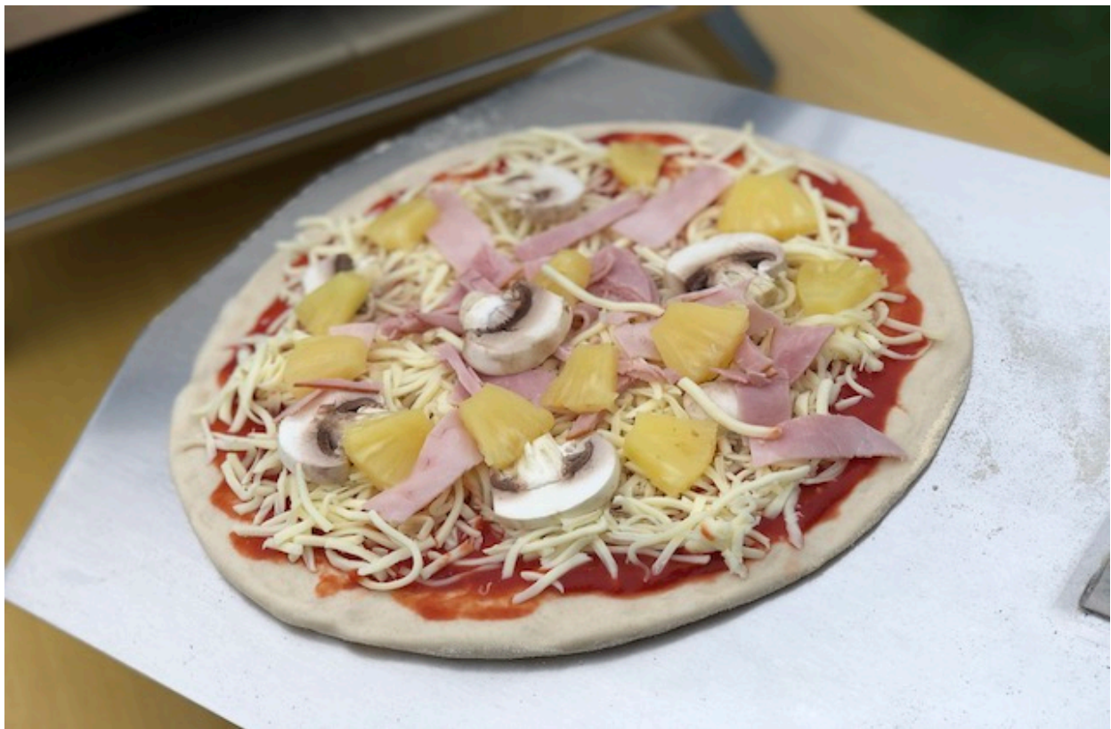
Pizza på vej ind i Uuni Pro