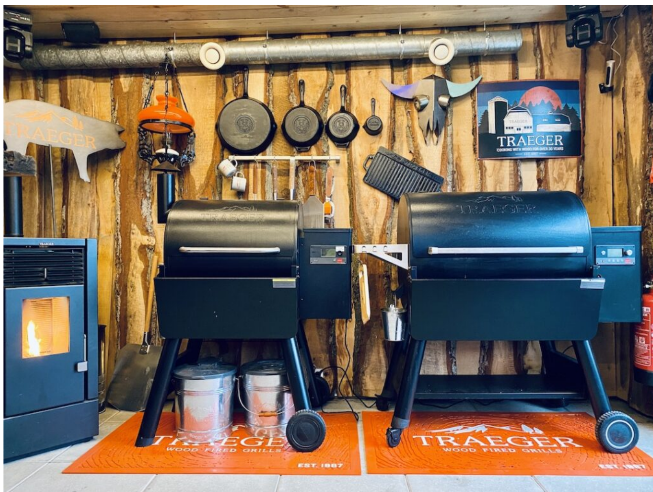
Min Traeger Grill Pit