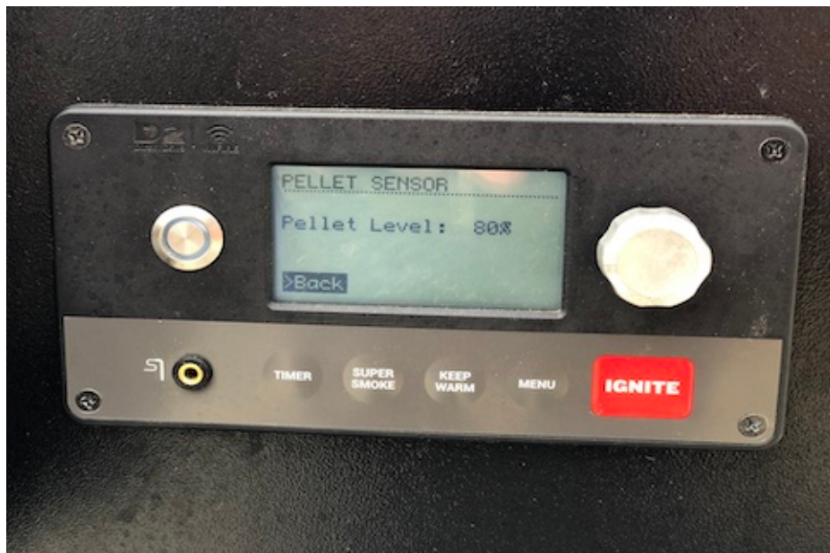
Pelletlevel vises på Traeger display