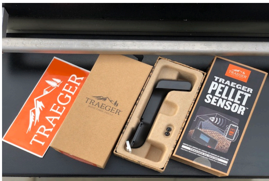
Traeger Pelletsensor Unboxing

Den ny Pelletsensor fra Traeger passer til følgende modeller: Traeger Pro 575 & 780* og Traeger Ironwood 650 & 885* , og den koster vejledende 799,- DKK. Jeg vil lige hurtigt vise jer hvad det her går ud på. Og hvordan du installerer den rigtigt. Det tager faktisk ikke engang 5 minutter og så er den monteret og klar til brug. Det der tager længst tid ved det er faktisk udpakning af dennes emballage ;). Og ja det tager nok også længer tid at læse det her end at montere Sensoren på grillen.