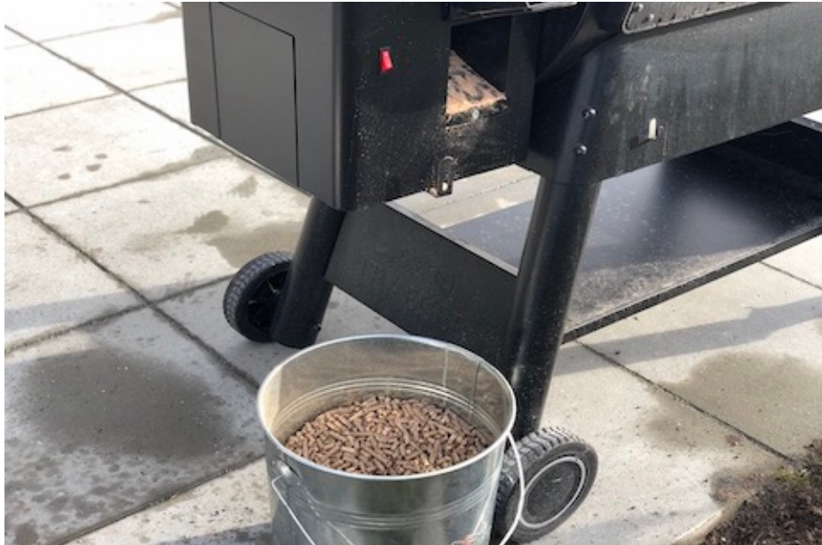
Traeger Ironwood 885 & Traeger Pillespand