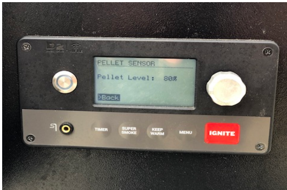
Pelletlevel vises på Traeger display