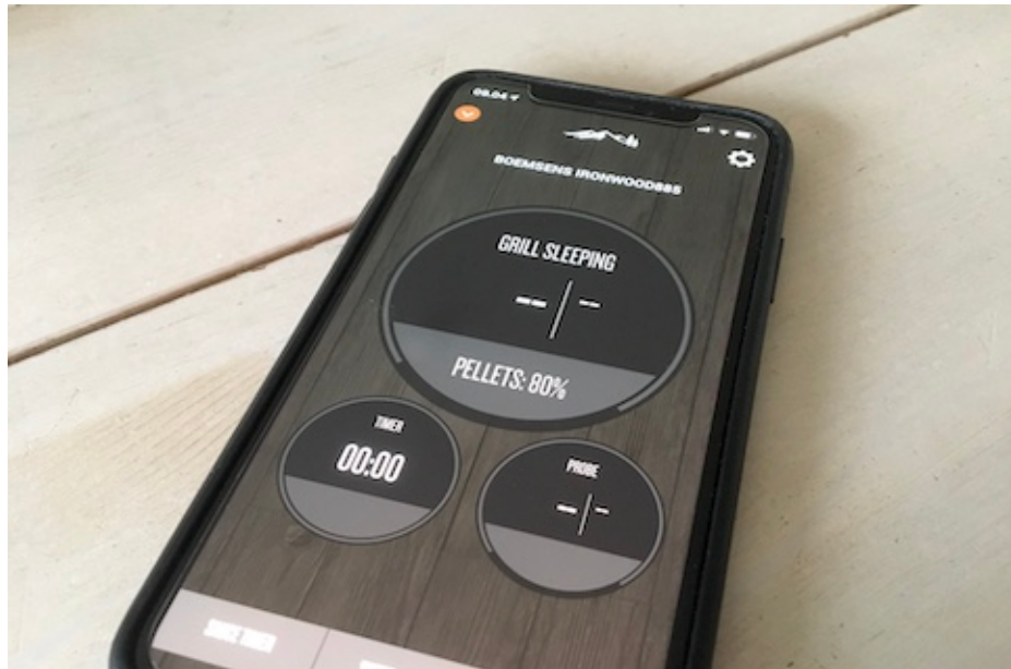
Pelletlevel vises i TraegerApp