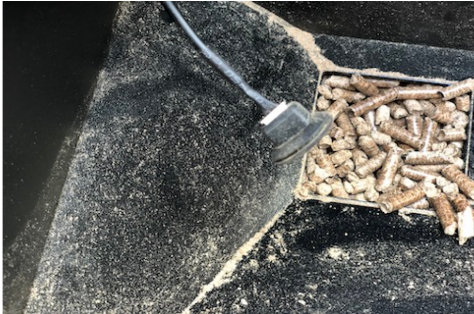
gummiprop med stik til pelletsensor