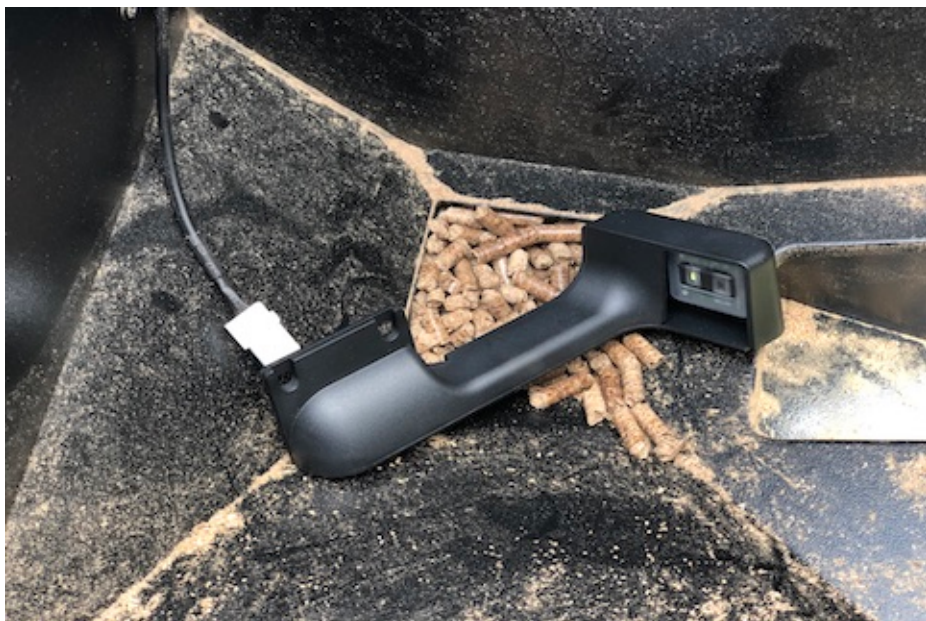
Montering af Traeger Pelletsensor