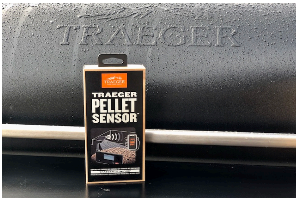
Traeger Pelletsensor på Ironwood 885