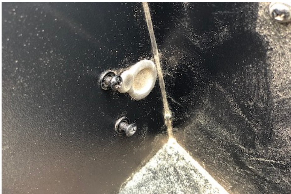
Fjern de to skruer op gummiprop