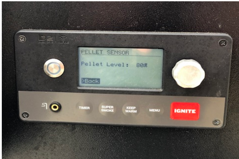
Pelletlevel vises på Traeger display