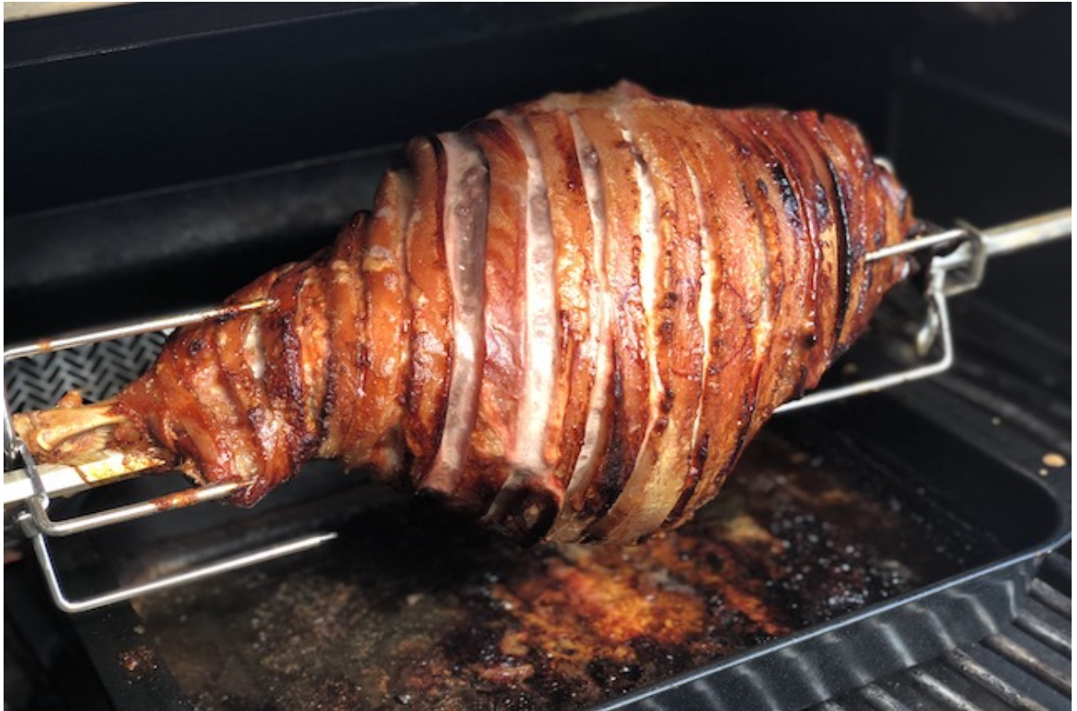
Skinke på Napoleon Prestige Pro 500 Rotisseri