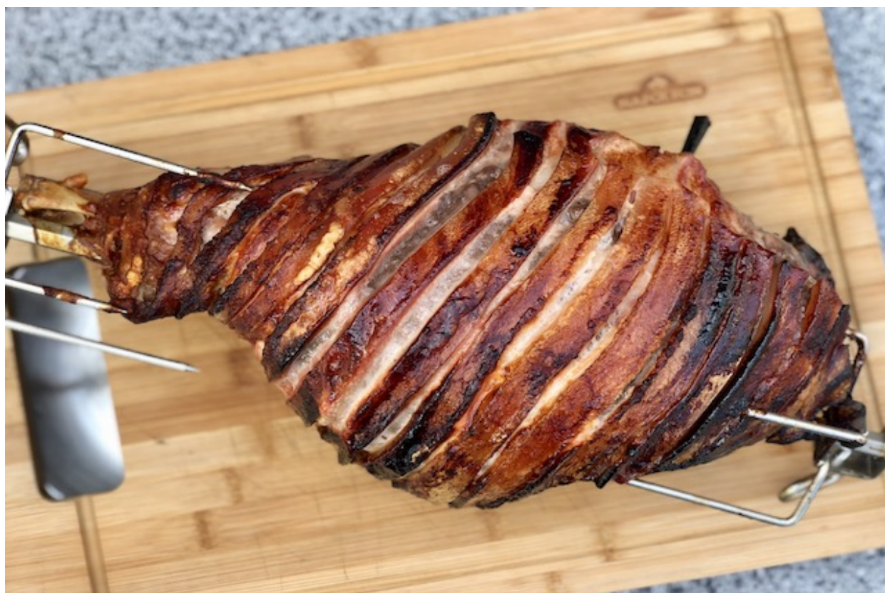
Svine Skinke på Rotisseri

Svineskank eller en hel Skinke tilberedt på rotisseri, er nok den bedste Steg jeg har smagt til dags dato. Især når den tilberedes over flere timer ved mellem høj varme. Men når man laver sådan en hel skinke på små 5 kg er det meget vigtigt at man husker en drypbakke under Skinken. For at sikre sig at dennes gode saft ikke går spild. Man kan efterfølgende bruge dennes kødsaft i en opbagt sauce. Fremgangs måde er ens om du laver en hel Skinke eller en svineskanke. Jeg har lavet det med en Skinke som du kan se på billederne. Selvom jeg haft bestillet en skanke.