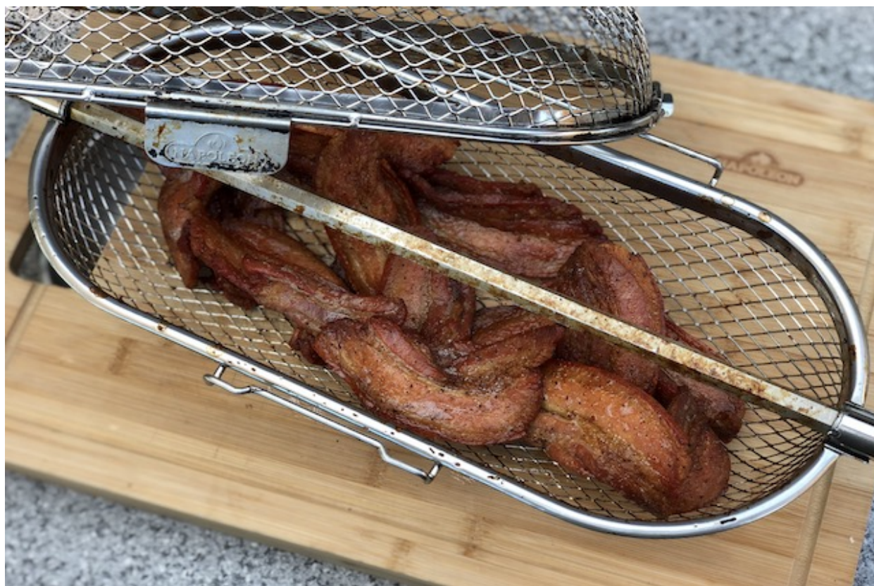
Stegt Flæsk på Rotisseri

forberedelses tid: 10 minutter, tilberedningstid: 45-60 minutter