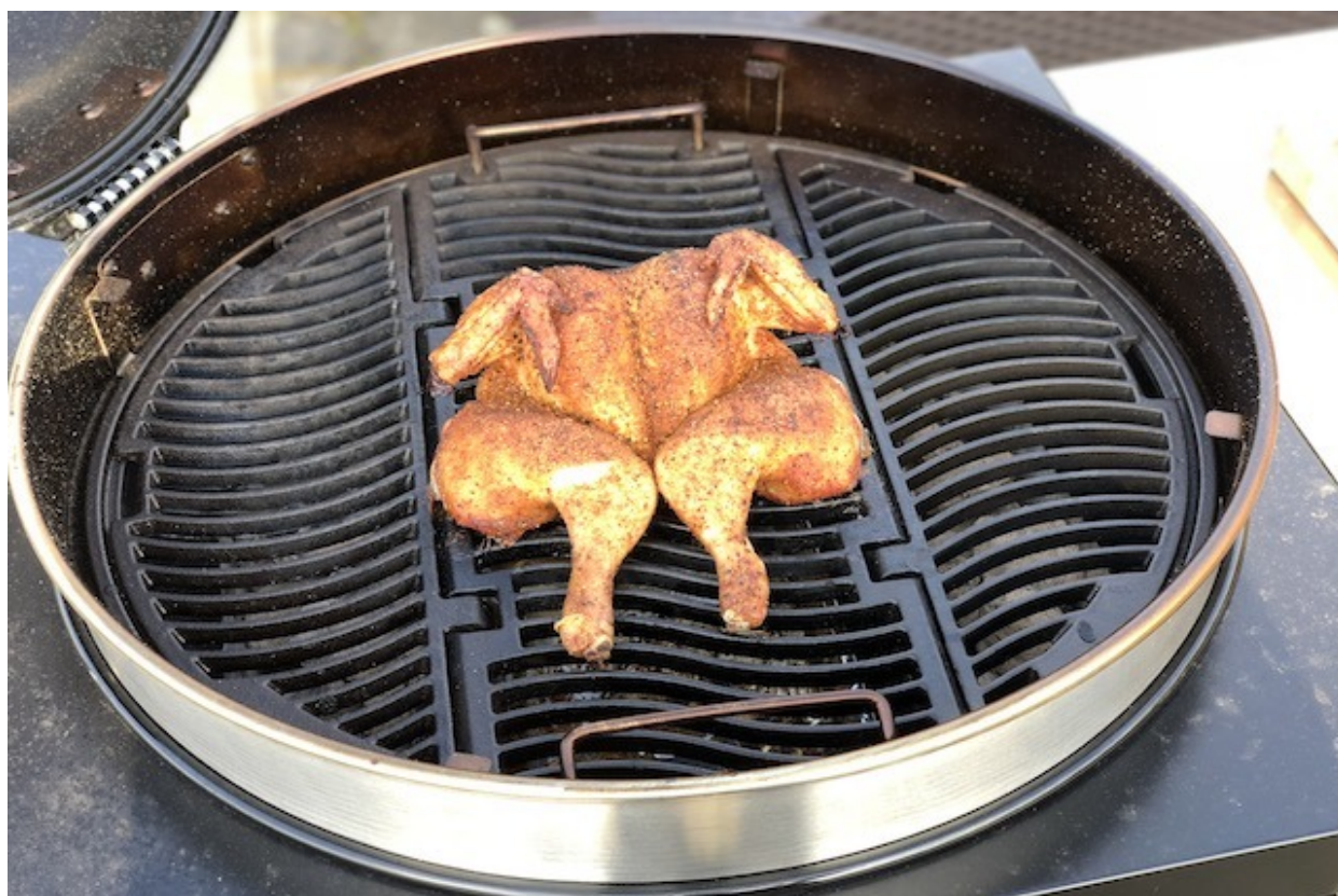
Spatchcook kylling på Napoloen Kuglegrill Pro22

Jeg har lavet denne Spatchcook Chicken på min Napoleon Kuglegrill Pro 22 . Hvis du gerne vil læse mere om min Napoleon kuglegrill kan du klikke her .