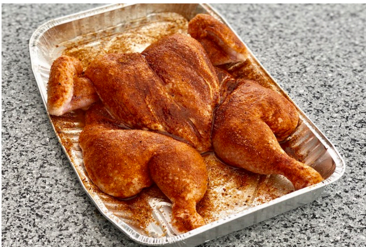
Spatchcock Chicken & Danish BBQ - Sweet Chicks BBQ RUB