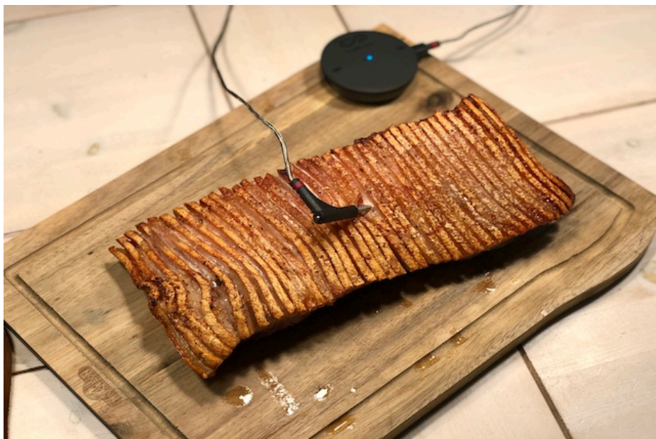
Røsnæs Duroc Ribbensteg fra Steak-Out.dk*