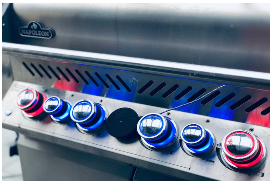
Napoleon Prestige Pro 500

Indstil din grill til 200° grader. Inden du går igang med forberedelsen. Og her er det ligegyldigt om det er en gas, kul, kamado, træpillegrill eller en ovn. Det eneste du skal sørger for at grillen er sat op til indirekte varme. Jeg har tændt for de to yderste brænder på min Napoleon Prestige Pro 500*