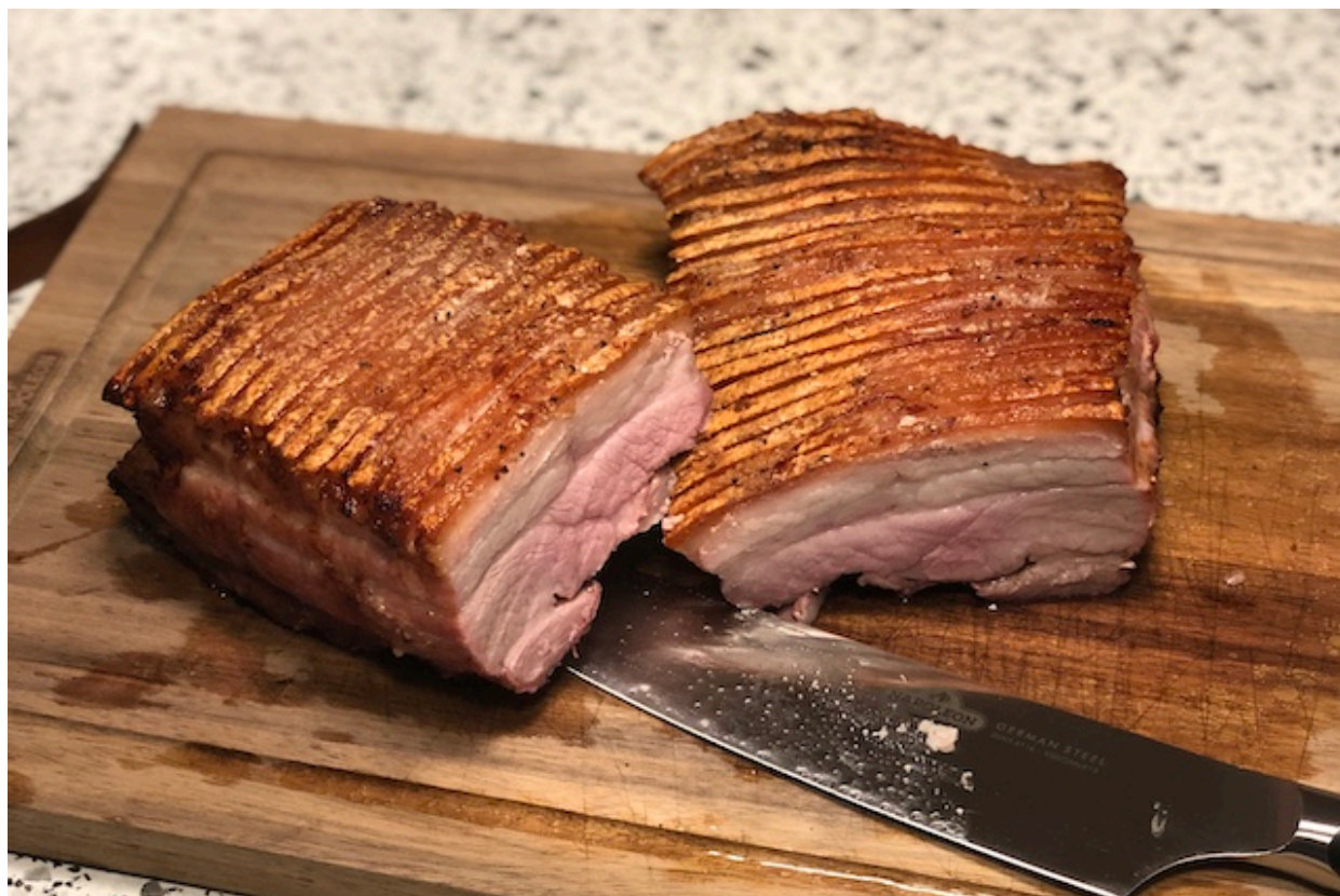
Røsnæs Duroc Ribbensteg

forberedelsestid ca. 30min. tilberedningstid: ca. 1,5-2 timer.