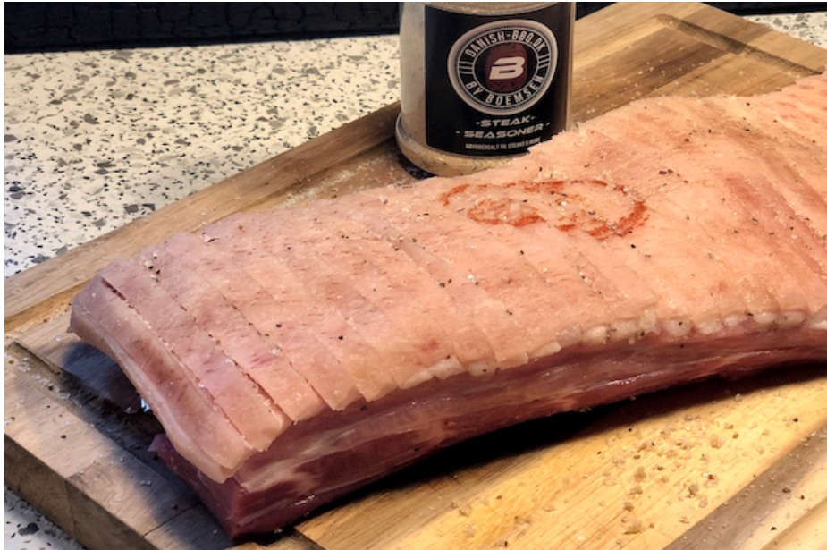
Duroc Ribbensteg med Danish BBQ Steak Seasoner