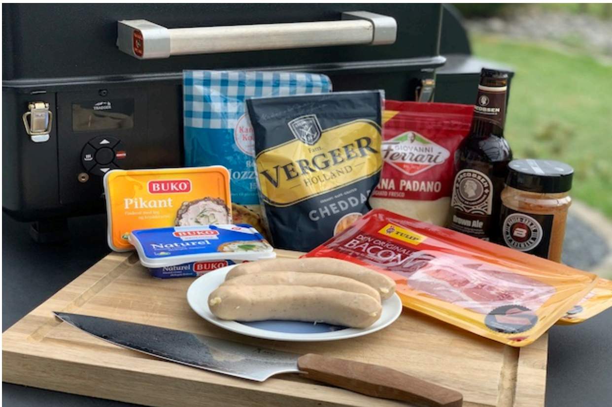
Ingredienser til Pig Shots

forberedelsestid ca. 10min. tilberedningstid: ca. 30min.