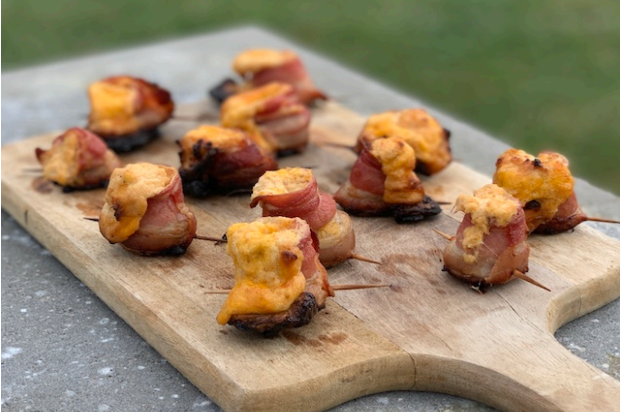
De færdig grillede Pig Shots

Og så er der kun en ting tilbage og det er at nyde de her små banditer.