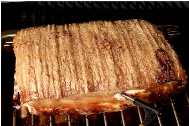
Flæskesteg lavet på en Traeger Proserie 22

Opskriften på Flæskesteg på Træpillegrillen finder du her: