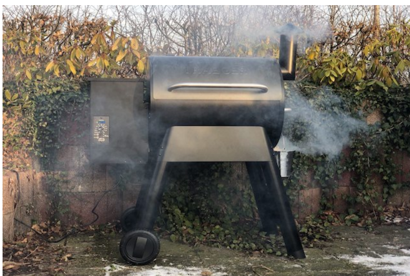
Traeger Pro Series 22

I øvrigt passerer røgen derefter gennem skorstenen ud af din pelletgrillet. I begyndelsen, når du tænder en Træpillegrill, kan du se en tydelig røgudvikling som så ligger sig når grillen er op på drifts temperatur.