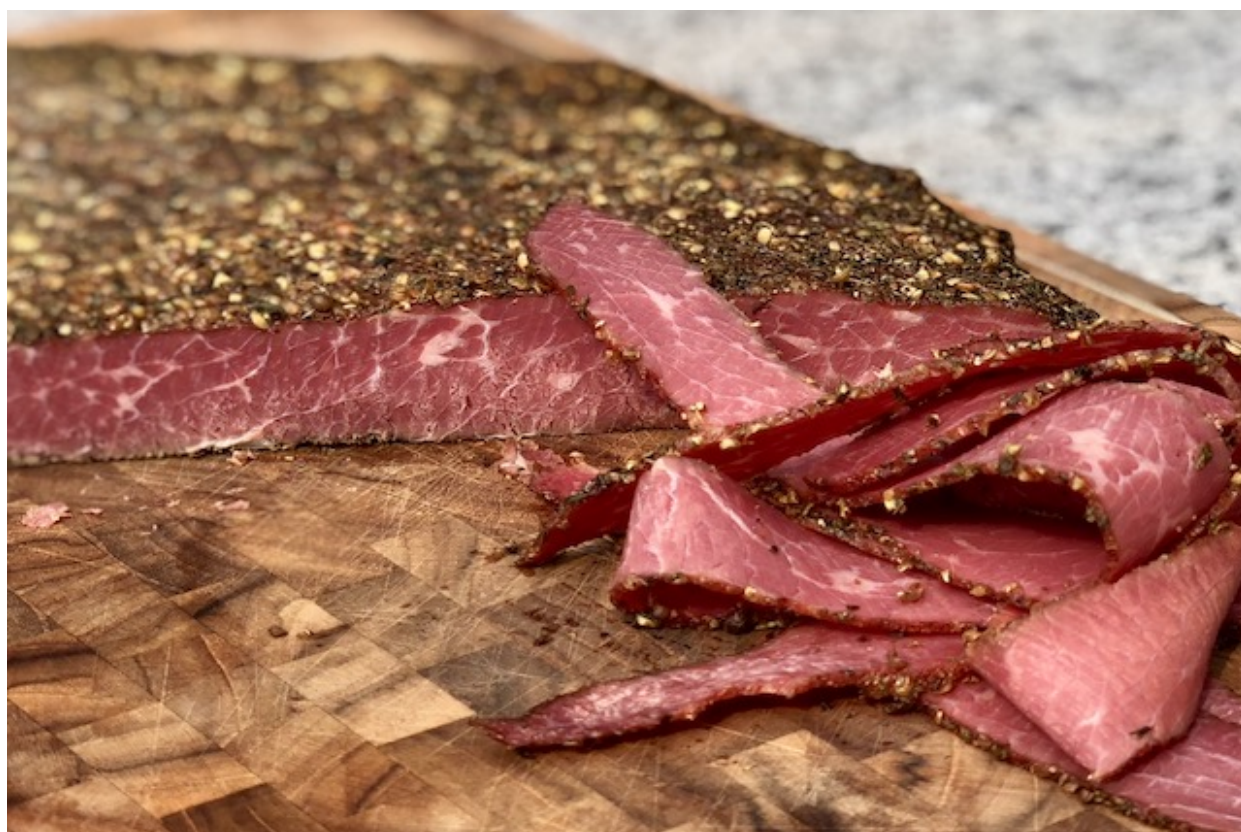
Pastrami - New York Style, af en ægte Wagyu Beef Brisket Flat

Det har længe stået på min TO-Do-List og nu var der endelig på tid til at jeg kaster mig ud i dette projekt. Jeg har læst mange artikler på nettet om Pastrami. De vigtigste og bedste informationer har jeg brugt til at finde frem til den efter min mening bedste Pastrami opskrift.