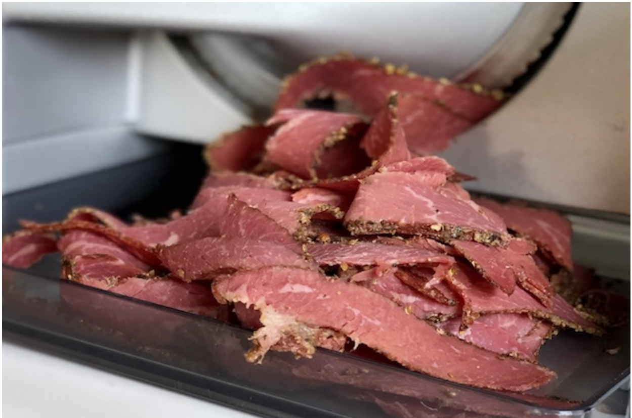
Pastrami, frisk skåret i 1,5mm tykke skiver

Mit andet stykke Pastrami forbliver i alt 3 uger i Vakuum. Jeg vil teste, i hvilket omfang en 3 ugers opbevaringstid har en positiv effekt på smagen. Hvis du har været stærk nok, har ventet længe nok nu, er det tid til skære Pastramien ud i ca. 1,5 mm tykke skiver, jeg gjorde det med min 31 år gamle Graef Pålægmaskine.