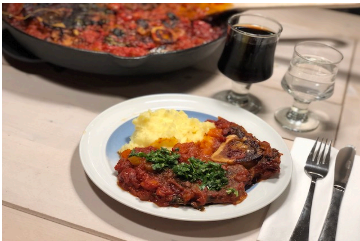
Osso Buco - italiensk simreret med kærlighed

forberedelsestid ca. 30min. tilberedningstid: ca. 4,5 timer.