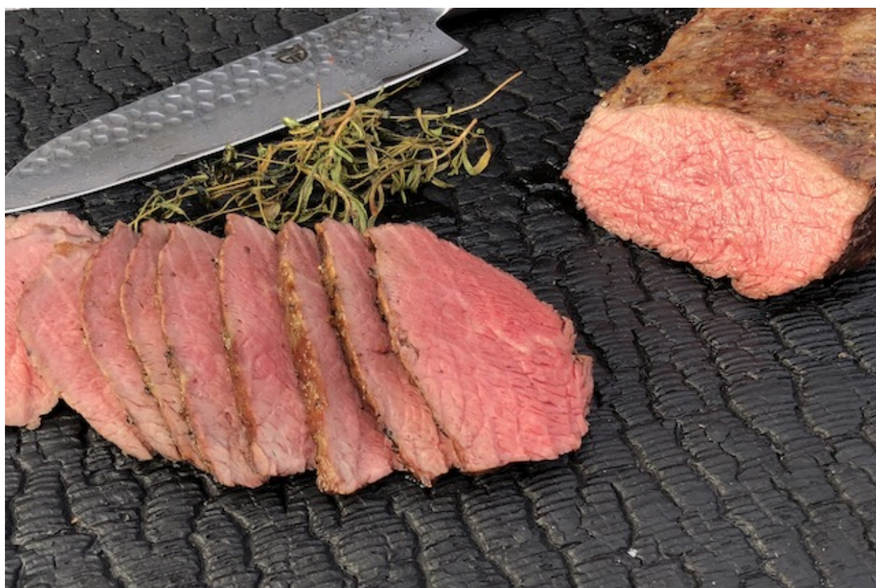
Cuvette stegt perfekt på grillen

Oksecuvette er et fantastisk stykke kød, det er meget nemt at tilberede og smager virkelig fantastisk til næsten alt. Det vigtigste ved en Cuvette steg er at man lader den hvile i 10 til 15 minutter inden udskæring. Jeg vil gerne vise jer hvordan man griller en Amerikansk kornfodret Oksecuvette. Så den ligner en million og naboen bliver kridt hvid af misundelse han skal over og have lækkert mad fra grillen.