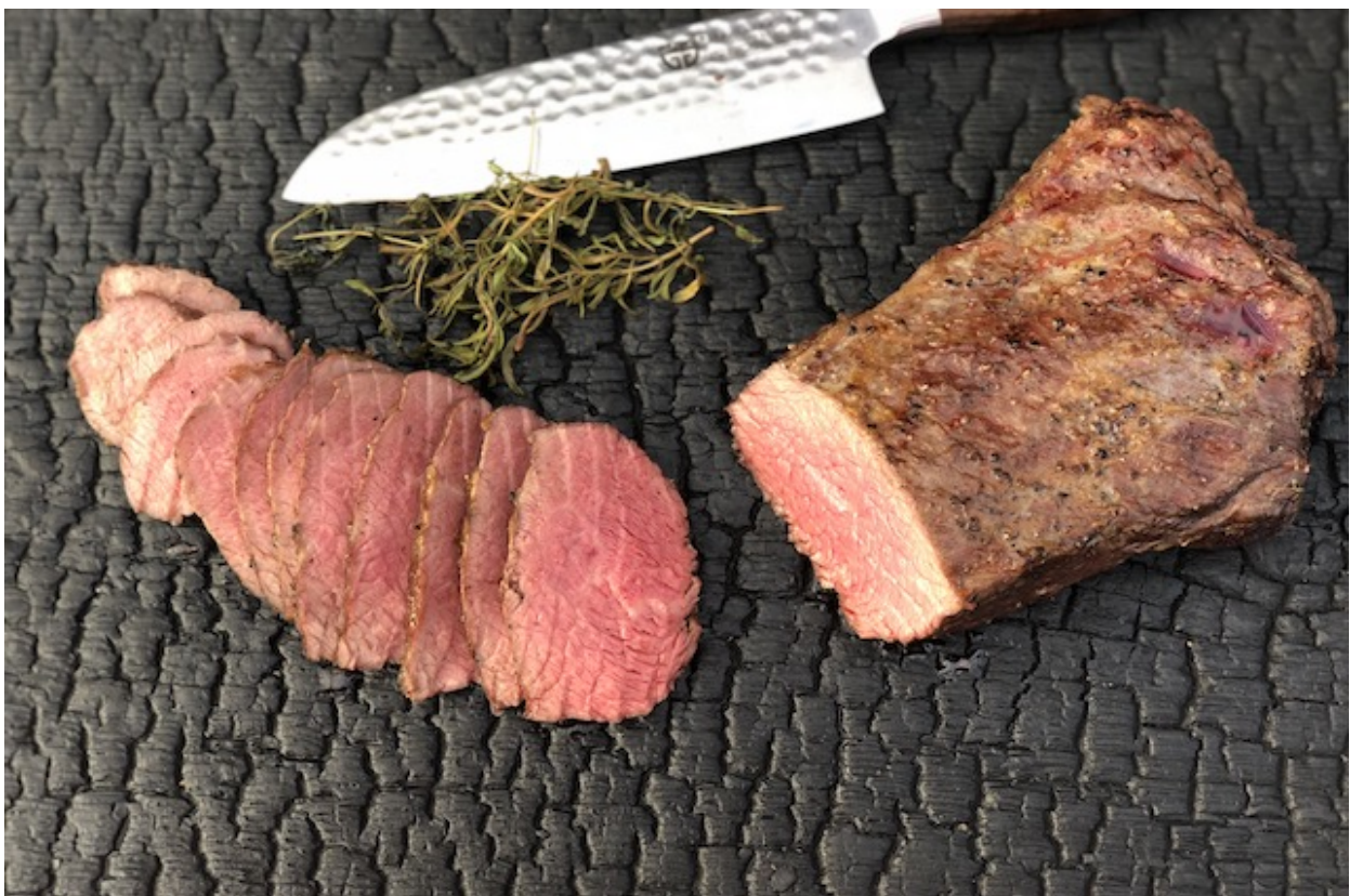
Oksecuvette stegt perfekt på grillen

Det er nemmest at se på den rå steg, og man skal se på kødsiden - ikke fedtsiden.