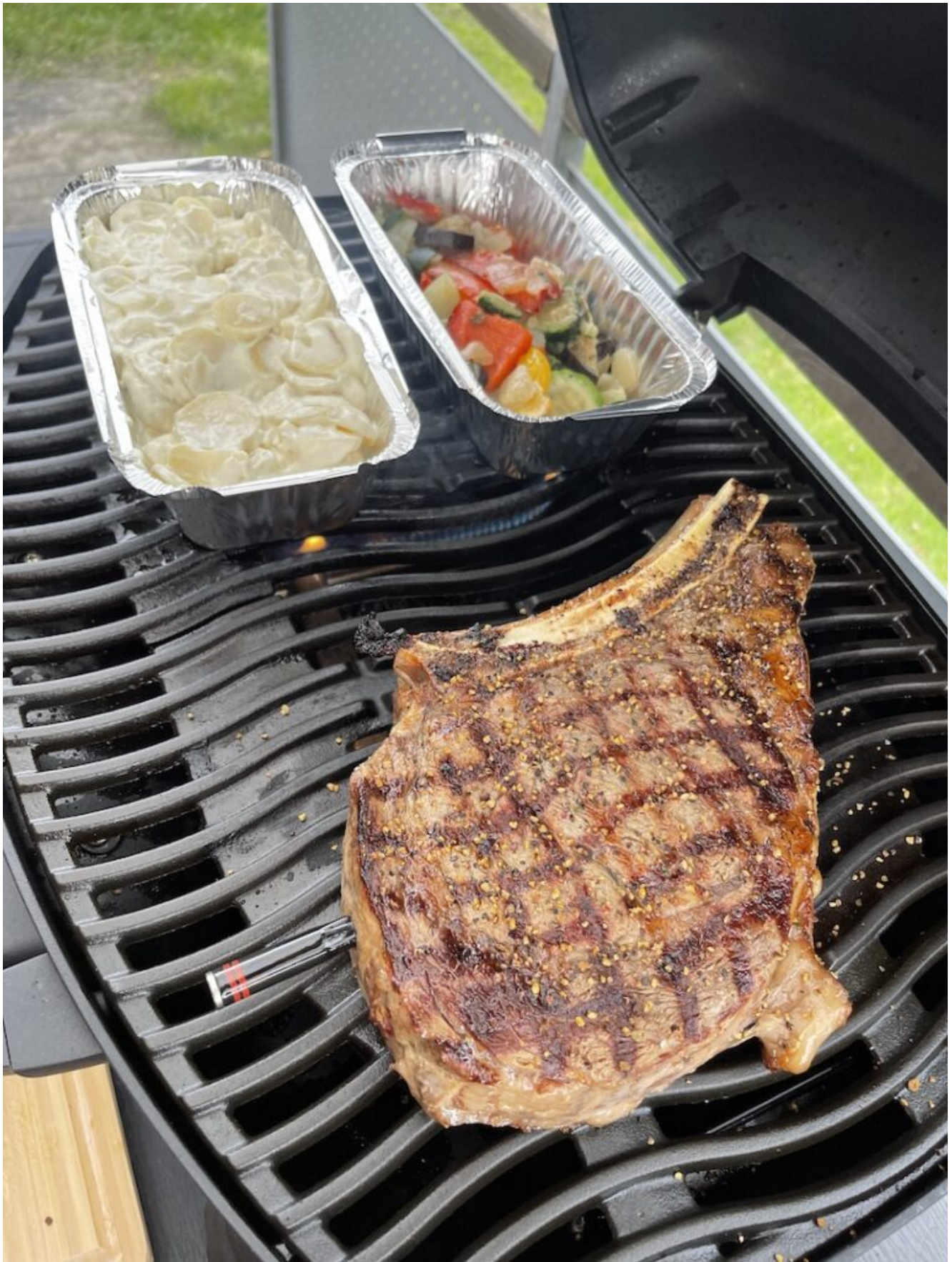
Lørdag: Cote de Boeuf af amerikansk ribeye på ben, dertil flødekartofler og blandet grønt.