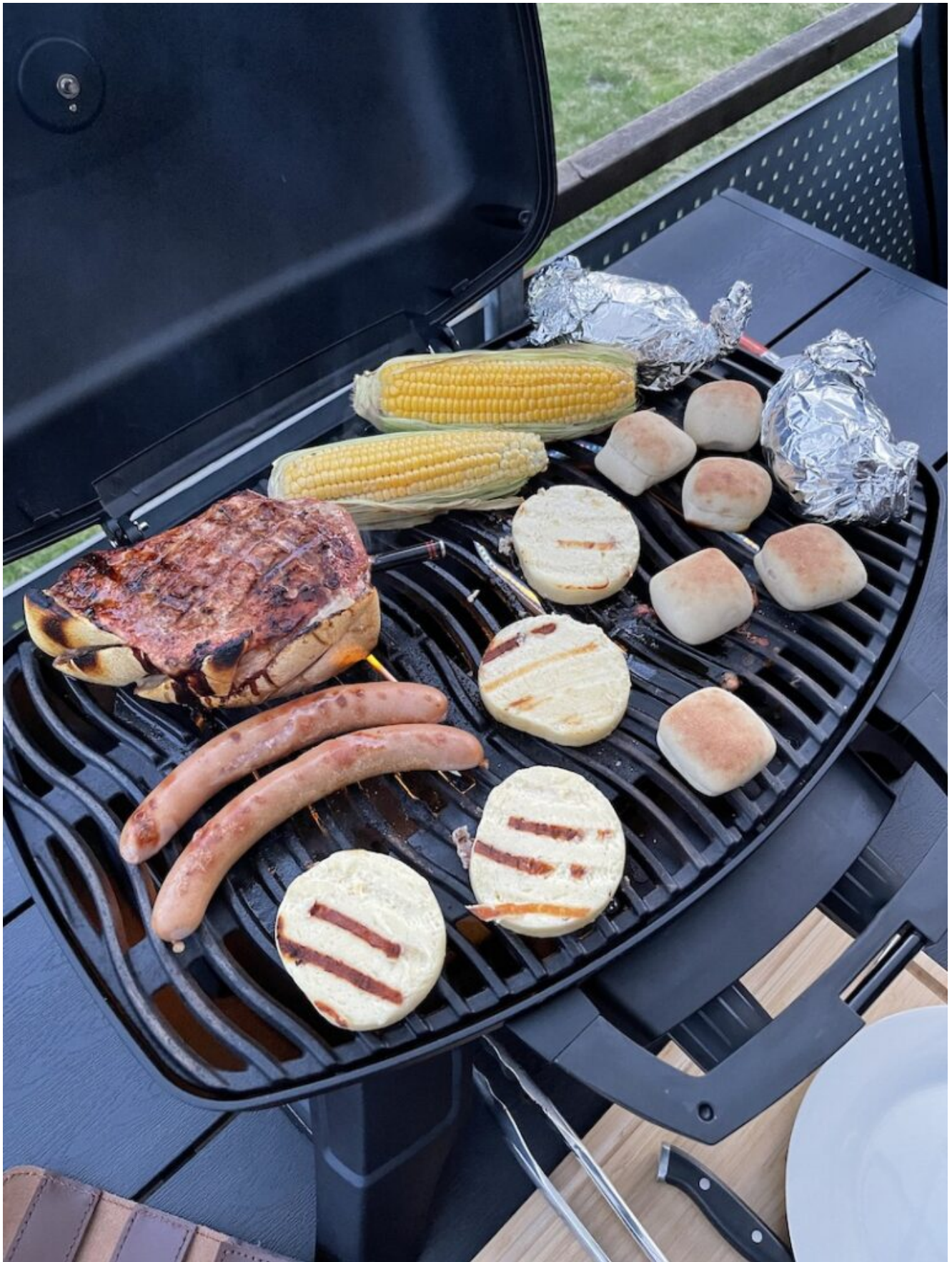
Fredag: Cote de Duroc af Dansk Duroc grise dertil grillet majs, foliekartofler, grilledehavarti ost.