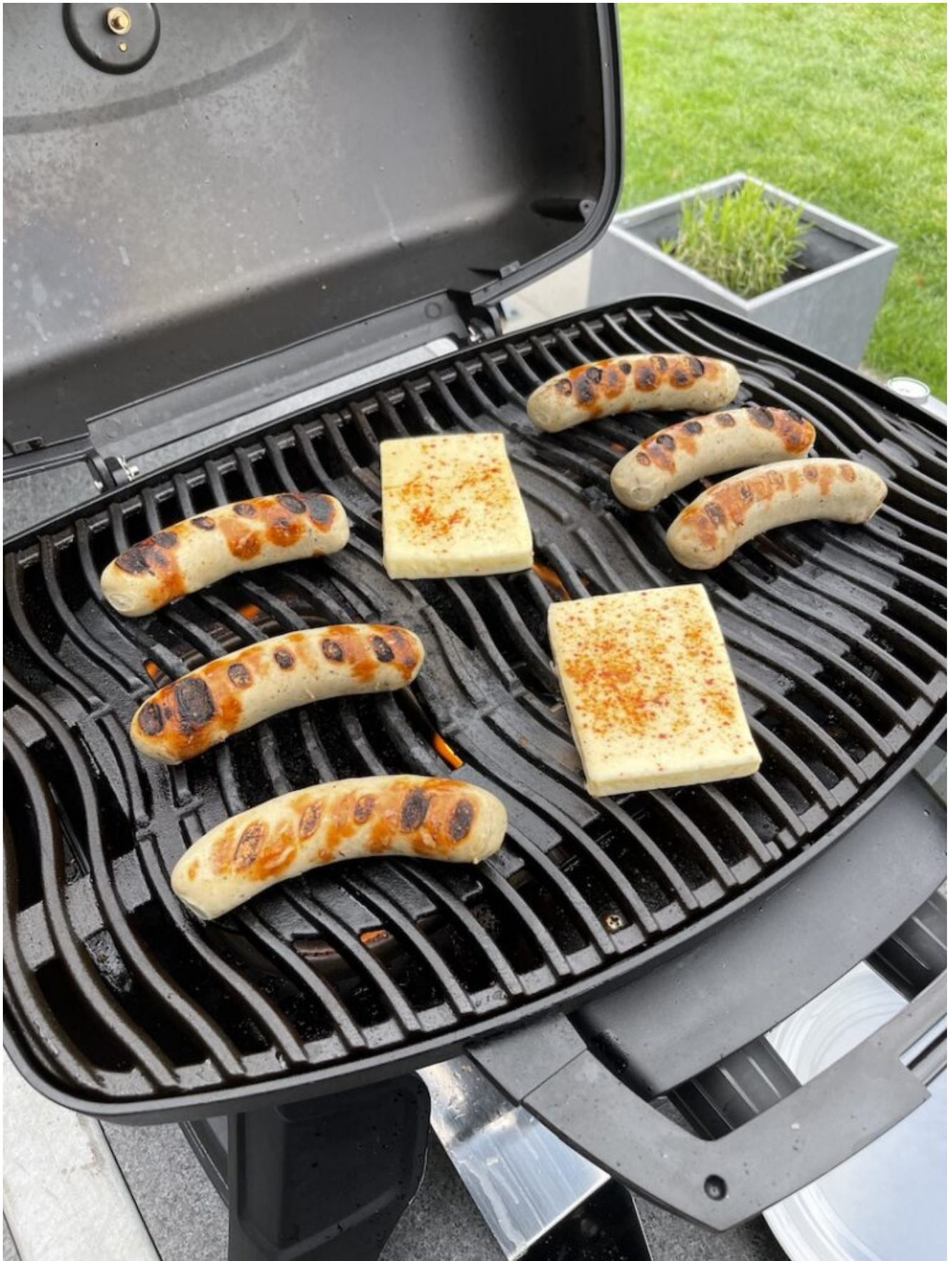
Søndag: alm. grillpølser grillet fetaost og kartoffelsalt