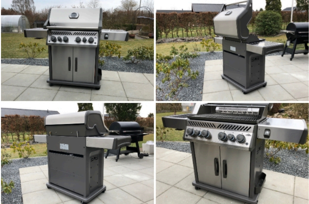
Napoleon Rogue 525SE 2020 Serie

I stedet for et temmelig svagt glødende blå lys, lyses kontroll knapperne, med et lyst hvidt baggrunds-lys. Dette ser ikke kun fedt ud når det er mørkt, det giver også grillen det sidste touch. Grillristene er baseret på de afprøvede Wave-rustfrie stålrister, som man typisk kender fra Napoleon. Hvis du foretrækker at benytte støbejernsriste i din gasgrill, kan man købe dem som tilbehør til Napoleon Rogue 525 SE* .