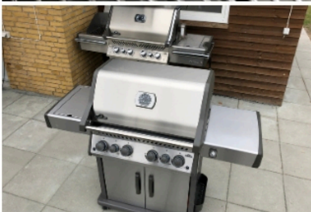
Napoleon Rogue 525Special Edition 2020