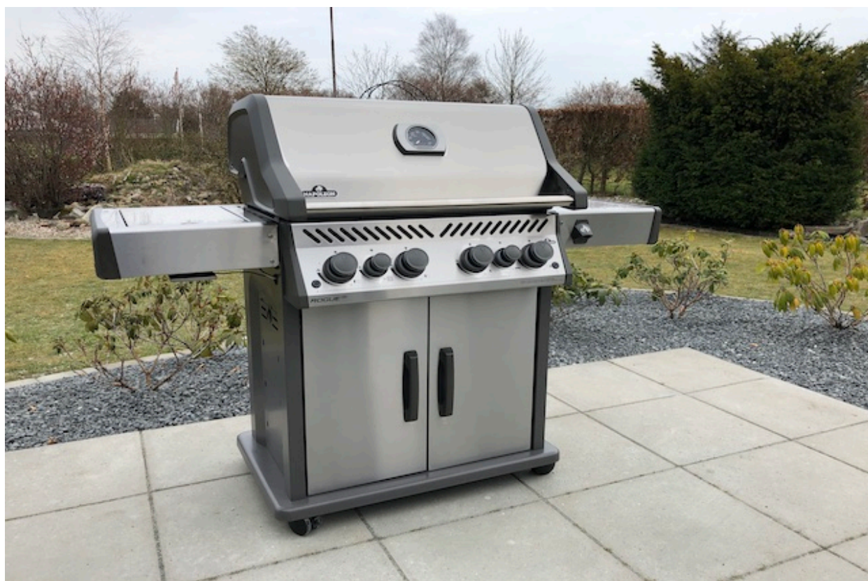
Napoleon Rogue 525SE model 2020

Inden vi kaster os ud i de enkelte detaljer og nørder i dybden, vil jeg kort ridse op, hvad grillen kan, så vi alle er med på, hvad Napoleon Rogue 525 SE* tilbyder.