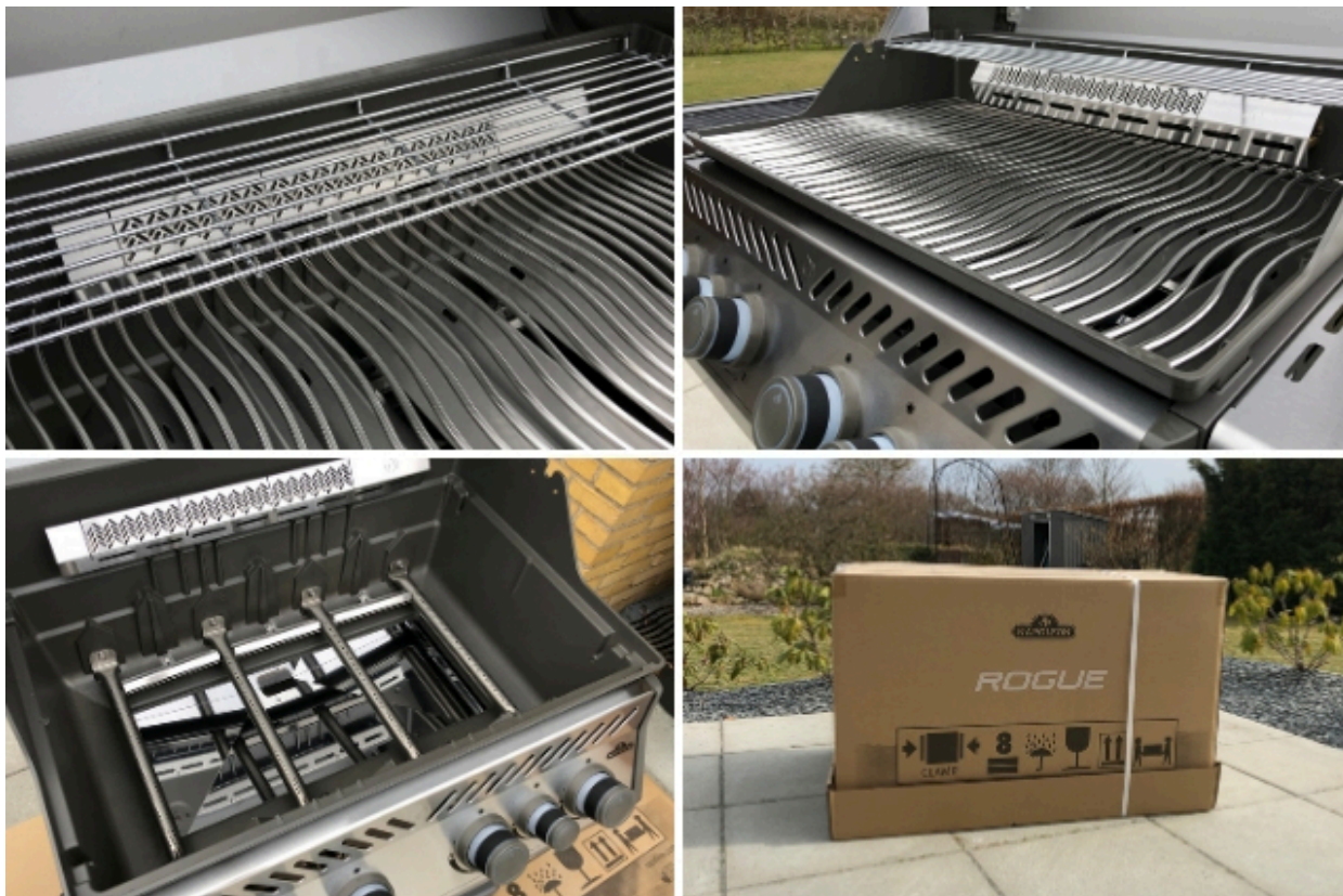
Napoleon Rogue 525 Special Edition model 2020