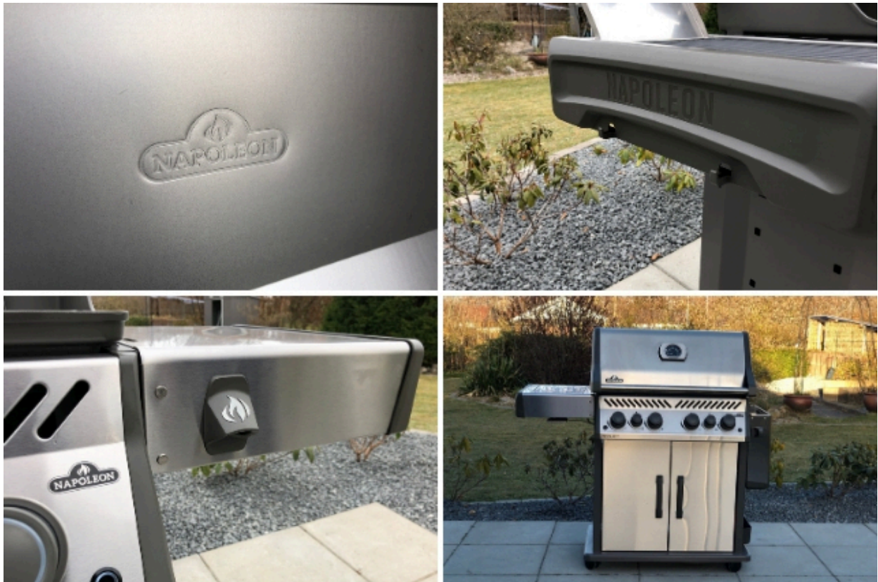
Napoleon Rogue 525SE model 2020