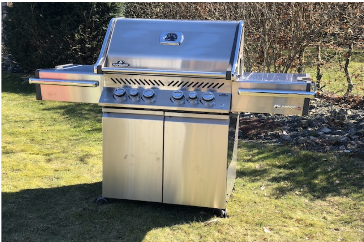
Napoleon Prestige Pro 500

Grillen har sideborde på begge sider. Det højre bord er udstyret med et integreret skærebræt og marinadebox til forberedelse og tilberedning direkte på grillen. Ud over forberedelsesoverflade har NAPOLEON Prestige Pro 500 også redskabskroge og tilbehørsholdere til opbevaring af grilltænger, saucer, krydderier og andre gadgets.