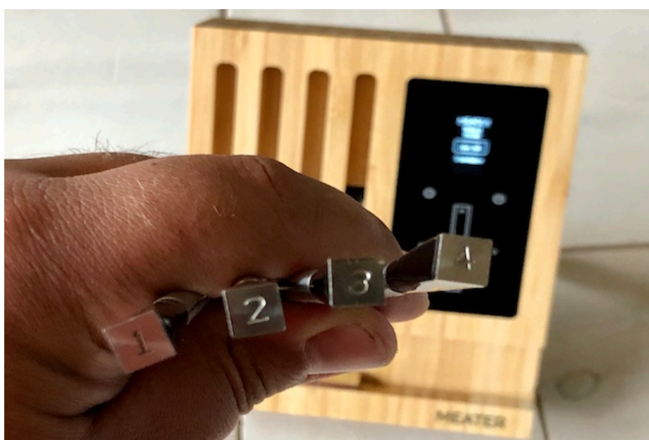
Meater Block og de fire enkelte Meater Probes

Den særlige funktion ved MEATER-blokken er først og fremmest, at den er helt trådløs. Ingen irriterende kabler, der skal klemmes under grilllåget som snores sammen igen og igen. Især når du bruger et rotisserie, er den trådløse temperaturføler uundværlig, fordi ethvert andet termometer med kabel vikler sig rundt om rotisseri spydet.