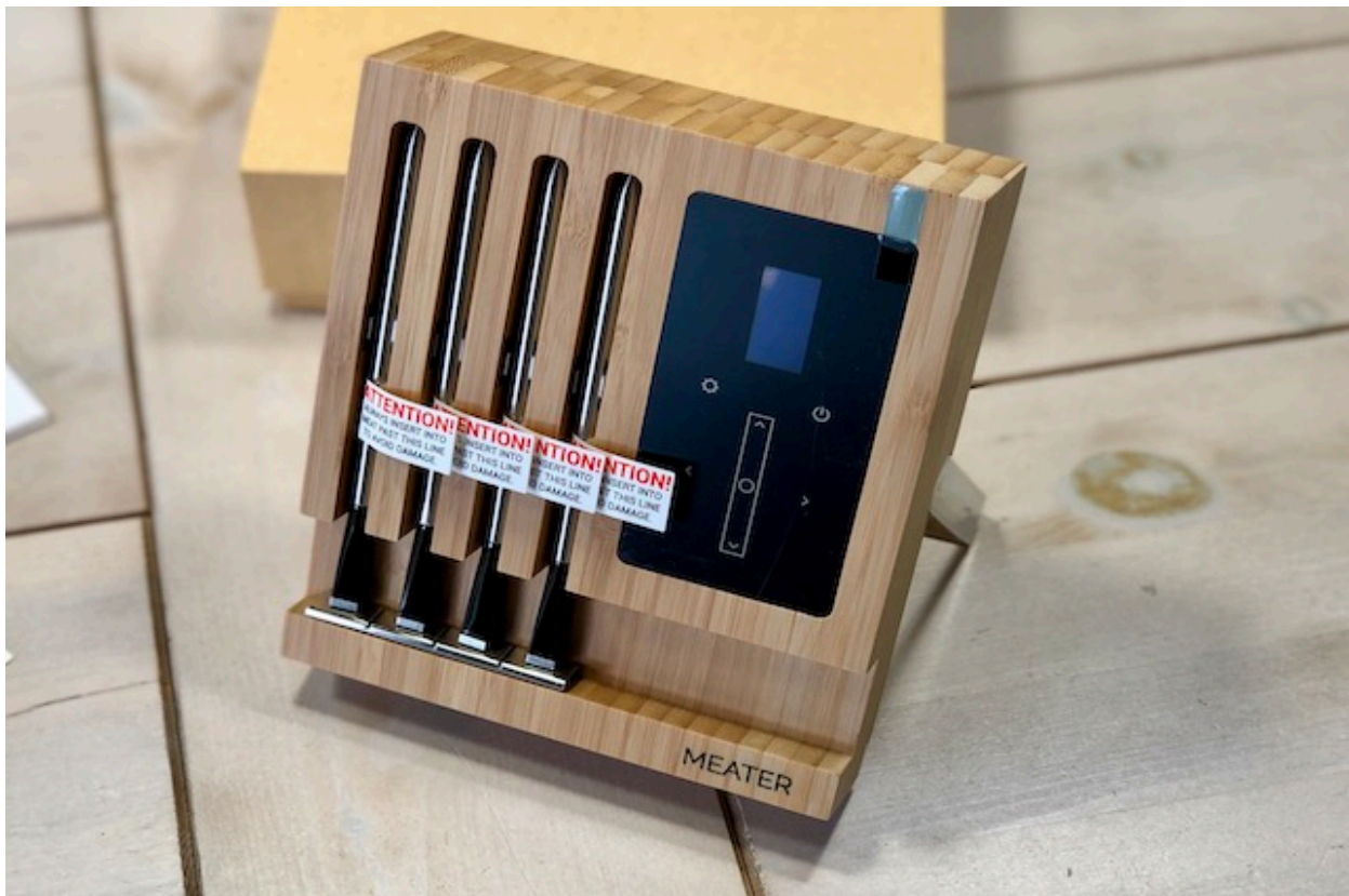
Meater Block Test - trådløs wifi Grill termometer

MEATER block test! Meater Blocken er det tredje grill termometer fra Apption Labs, som jeg har testet. Efter Meater og Meater+ kan man nu også købe deres storebror "MEATER BLOCK" med 4 temperaturføler.