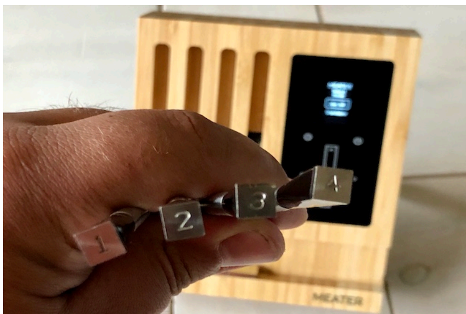
Meater Block og de fire enkelte Meater Probes

Den særlige funktion ved MEATER-blokken er først og fremmest, at den er helt trådløs. Ingen irriterende kabler, der skal klemmes under grilllåget som snores sammen igen og igen. Især når du bruger et rotisserie, er den trådløse temperaturføler uundværlig, fordi ethvert andet termometer med kabel vikler sig rundt om rotisseri spydet.