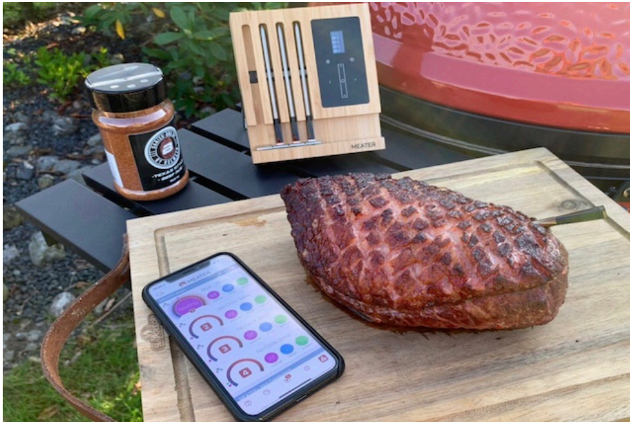
MEATER Block App

Appen er naturligvis meget mere behagelig og tilbyder meget flere muligheder end displayet. Opsætningen af appen er en leg og er næsten selvforklarende. Appen er tilgængelig til iOS og Android. Appens funktionalitet giver den samme komfort som ved brug af de enkelte MEATER, bortset fra at på skærmen i din mobil eller tablet vises alle 4 sonder.