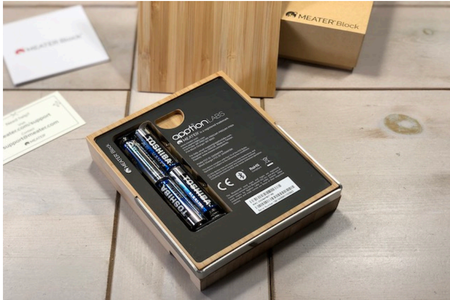
Bagsiden af MEATER Block "Batterifag"