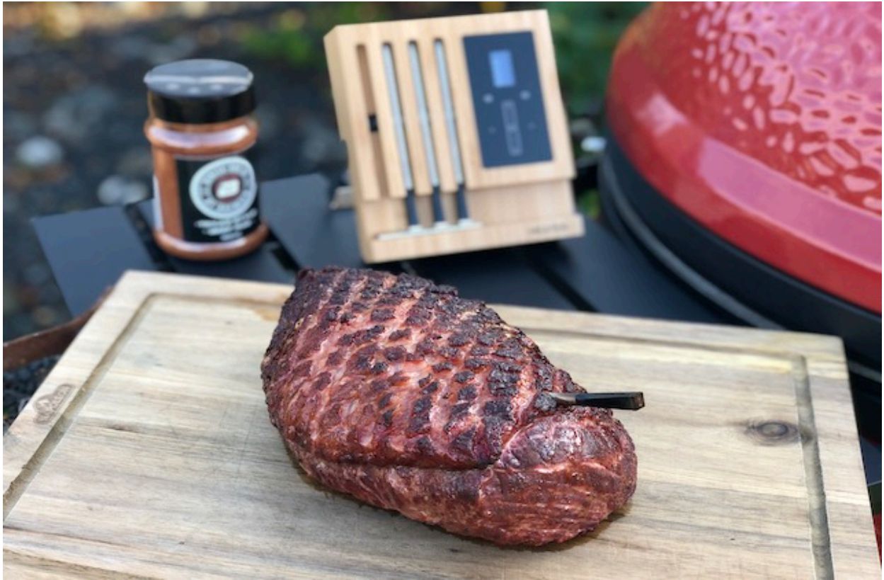
Ved hjælp af MEATER BLOKKEN bliver kødet perfekt tilberedt