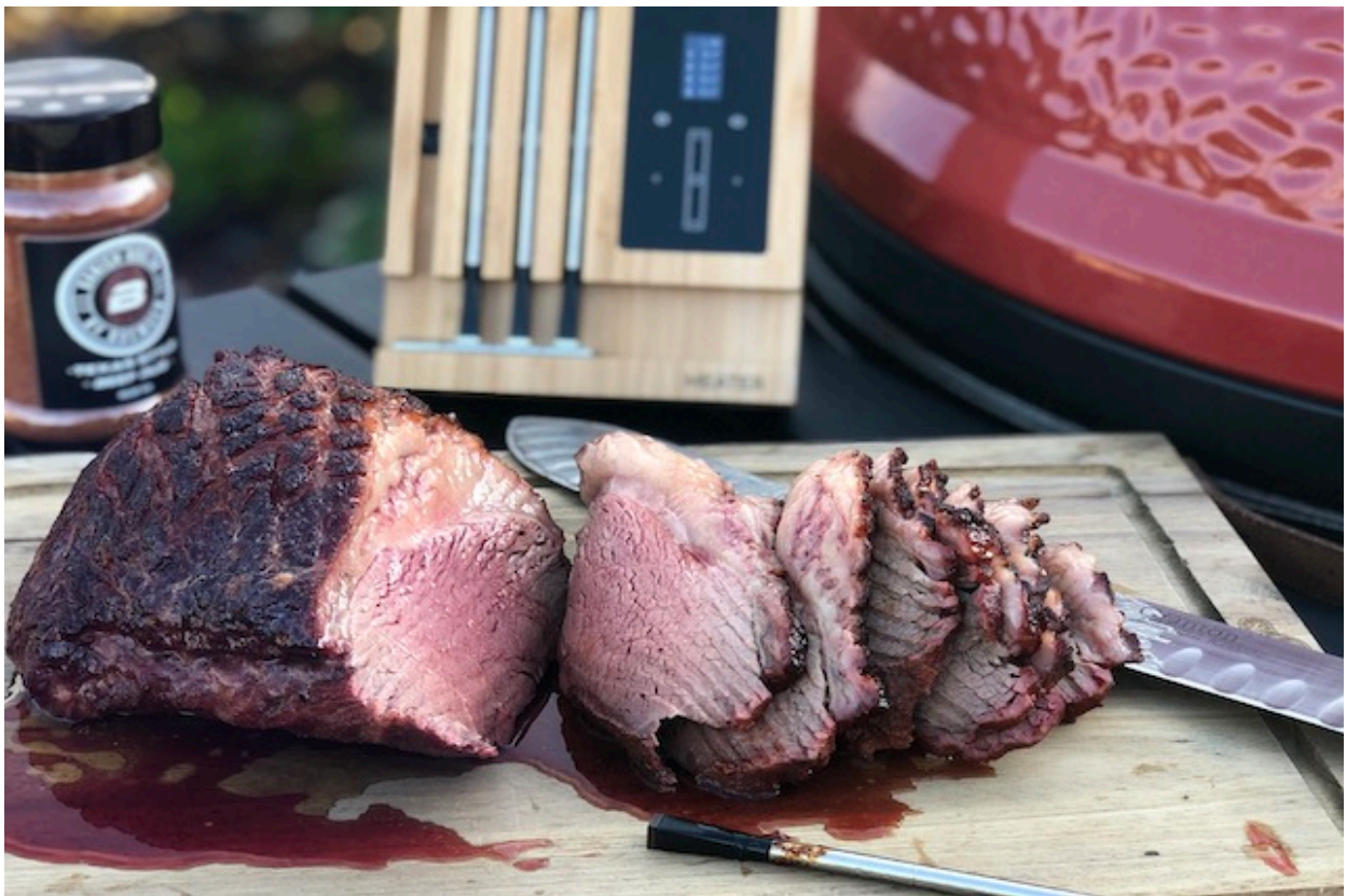
Perfekt grillet Cuvette med MEATER Block

Resultatet er et særligt saftigt stykke grillet cuvette. Som kritik har jeg her at