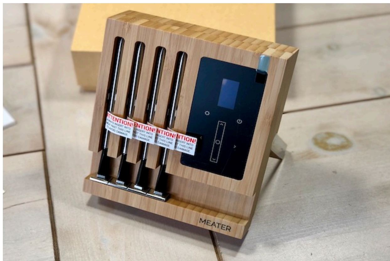
Meater Block Test - trådløs wifi Grill termometer

MEATER block test! Meater Blocken er det tredje grill termometer fra Apption Labs, som jeg har testet. Efter Meater og Meater+ kan man nu også købe deres storebror "MEATER BLOCK" med 4 temperaturføler.