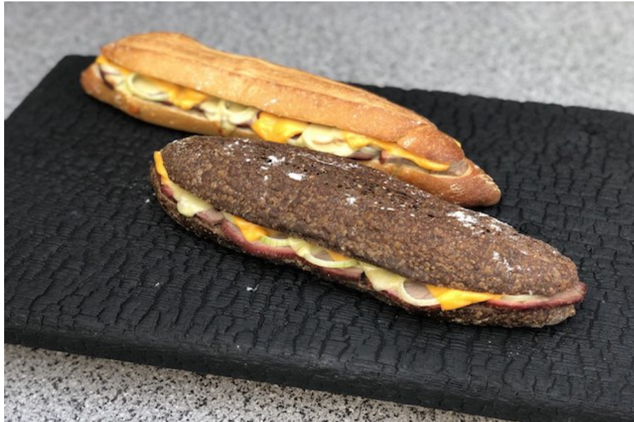
La Flutes ala boemsen'

Her finder du opskriften på Hvidløgsflutes: