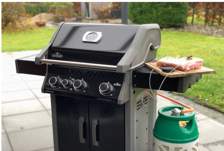
Napoleon Rogue 425 all black

Indstil din grill til 100° grader. Inden du går igang med forberedelsen. Og her er det ligegyldigt om det er en gas, kul, kamado, træpillegrill eller en ovn. Det eneste du skal sørger for at grillen er sat op til indirekte varme. Jeg har tændt for de to yderste brænder på min Napoleon Rogue 425 all black* .