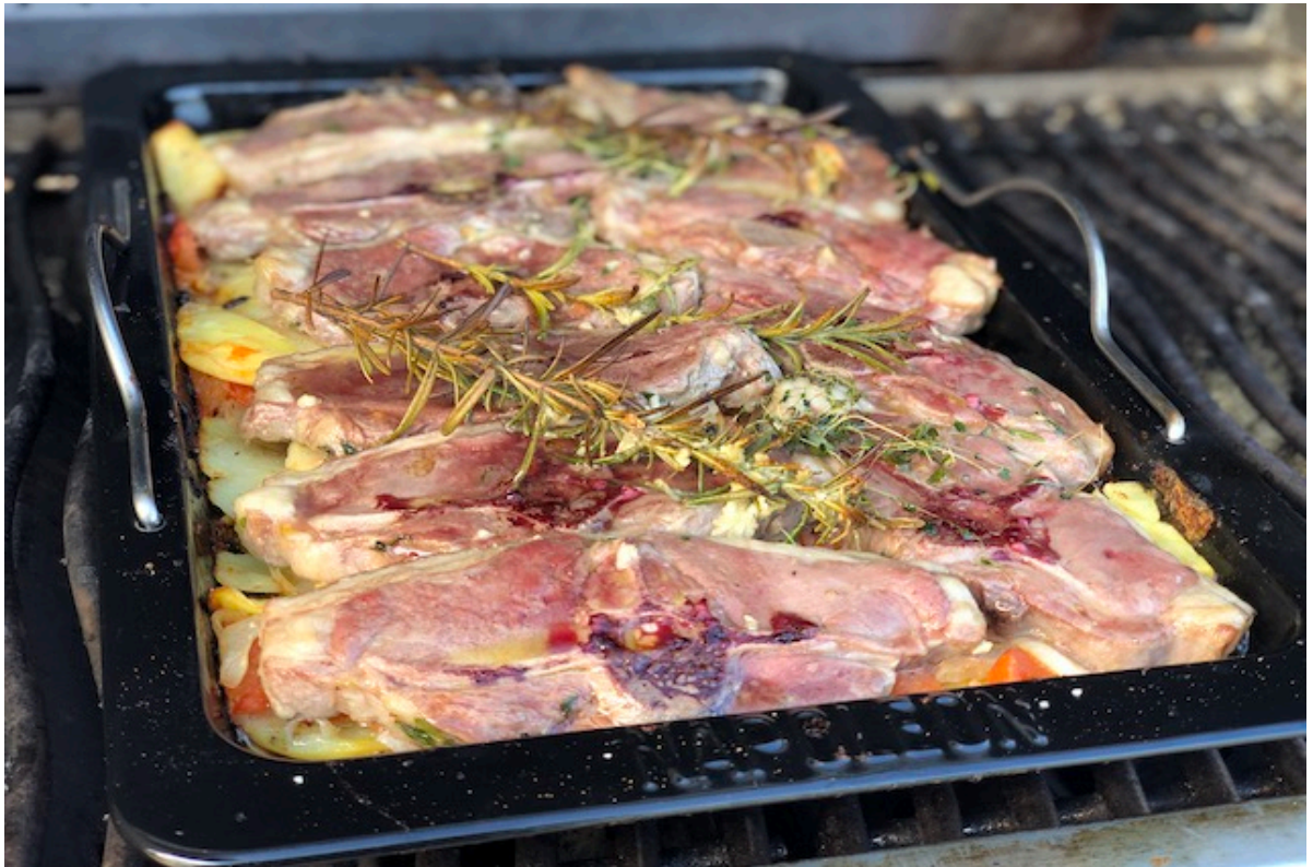
Lammekoteletter på Napoleon Drop-in Stegeplade

vælger for det meste medium og det er ved 67-68 grader i kernetemperatur. Er du mere til rosa kød så skal kerentemperaturen være 64 grader.