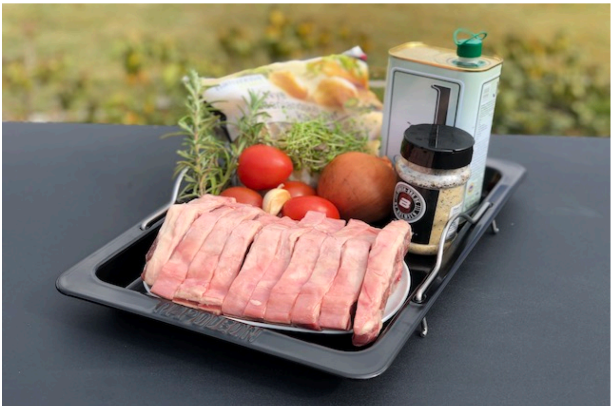
Ingredienser til Lammekoteletter i fad

forberedelsestid ca. 20min. tilberedningstid: ca.65min.