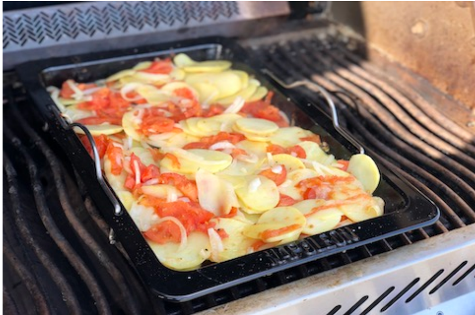
Napoleon Drop-in Stegeplade med kartofler tomater og løg efter 45 minutter