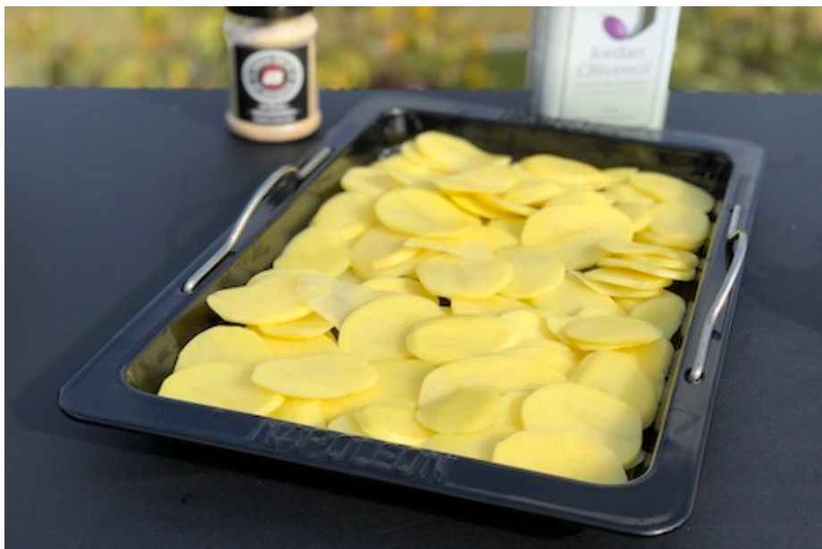
Napoleon Drop-in Stegeplade med skive skårene kartofler

7. Nu fordeler du dine kartoflerskiver ud i fadet.