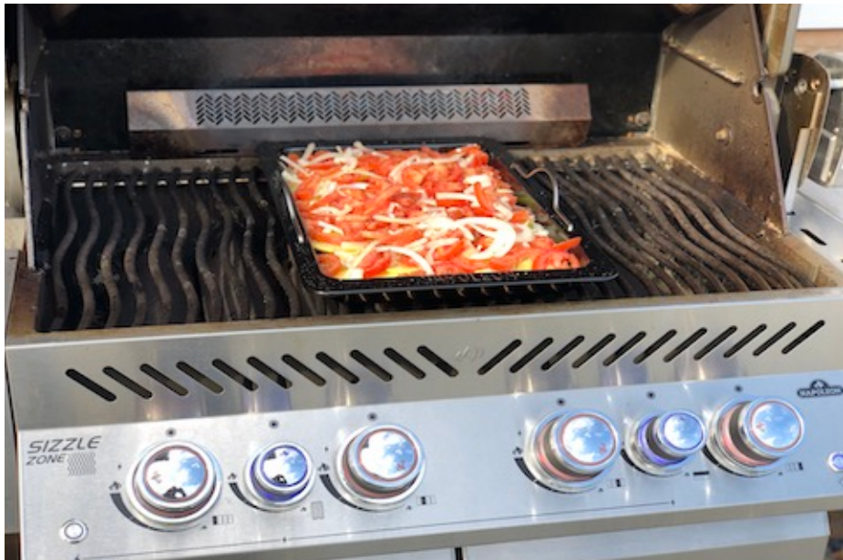
Napoleon Drop-in Stegeplade på Napoleon Prestige Pro500