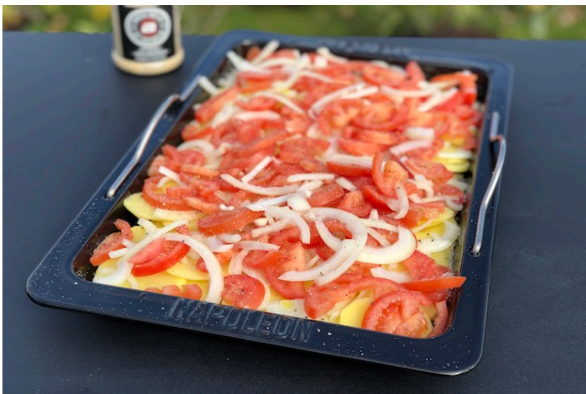
Napoleon Drop-in Stegeplade med kartofler, løg og tomatskiver

8. Efterfølgende spreder du dine tomat og løg skiver henover kartoflerne.