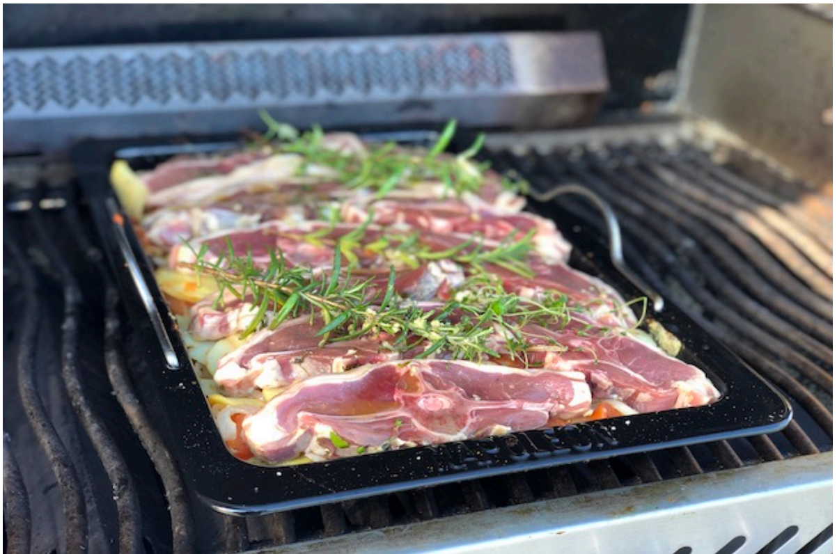
Napoleon Drop-in Stegeplade med Lammekoteletter