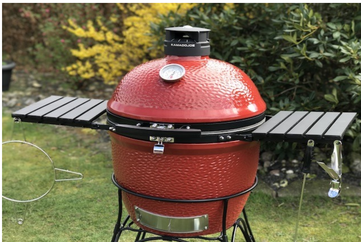
Kamado Joe Classic 2

Kamado Joe er en af de Keramikgrill har efterhåndet fundet vejen hjem til Danmark og etableret sig i den Danske grill scene de seneste år. De er ved at være blandt de mest eftertragtede og populære grill på markedet. Jeg tog et nærmere kig på Kamado Joe Ceramic Grill Classic II, fordi den adskiller sig i nogle detaljer fra sine konkurrenter.