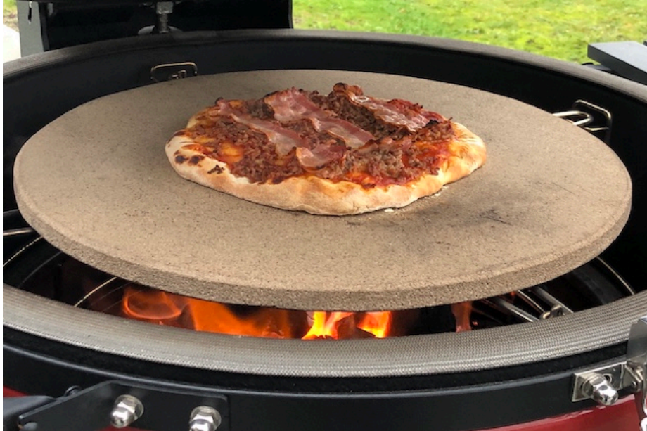
Børne Pizza på BigJoe 3

Men selv i de høje temperaturer op til henover 400 °C er ikke noget problem. I denne temperatur områdespiller den fantastisk til steaks og pizza.