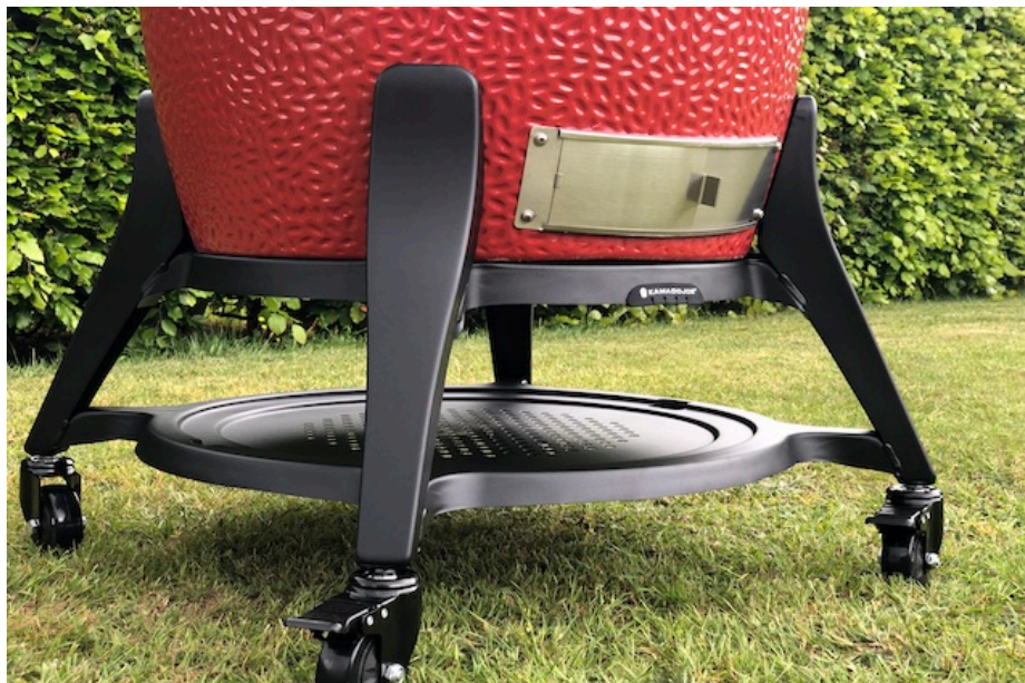
Big Joe 3 understel