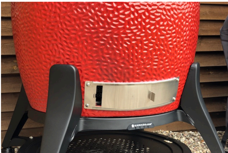
Den patenterede Askeskuffe sidder bag dette låg