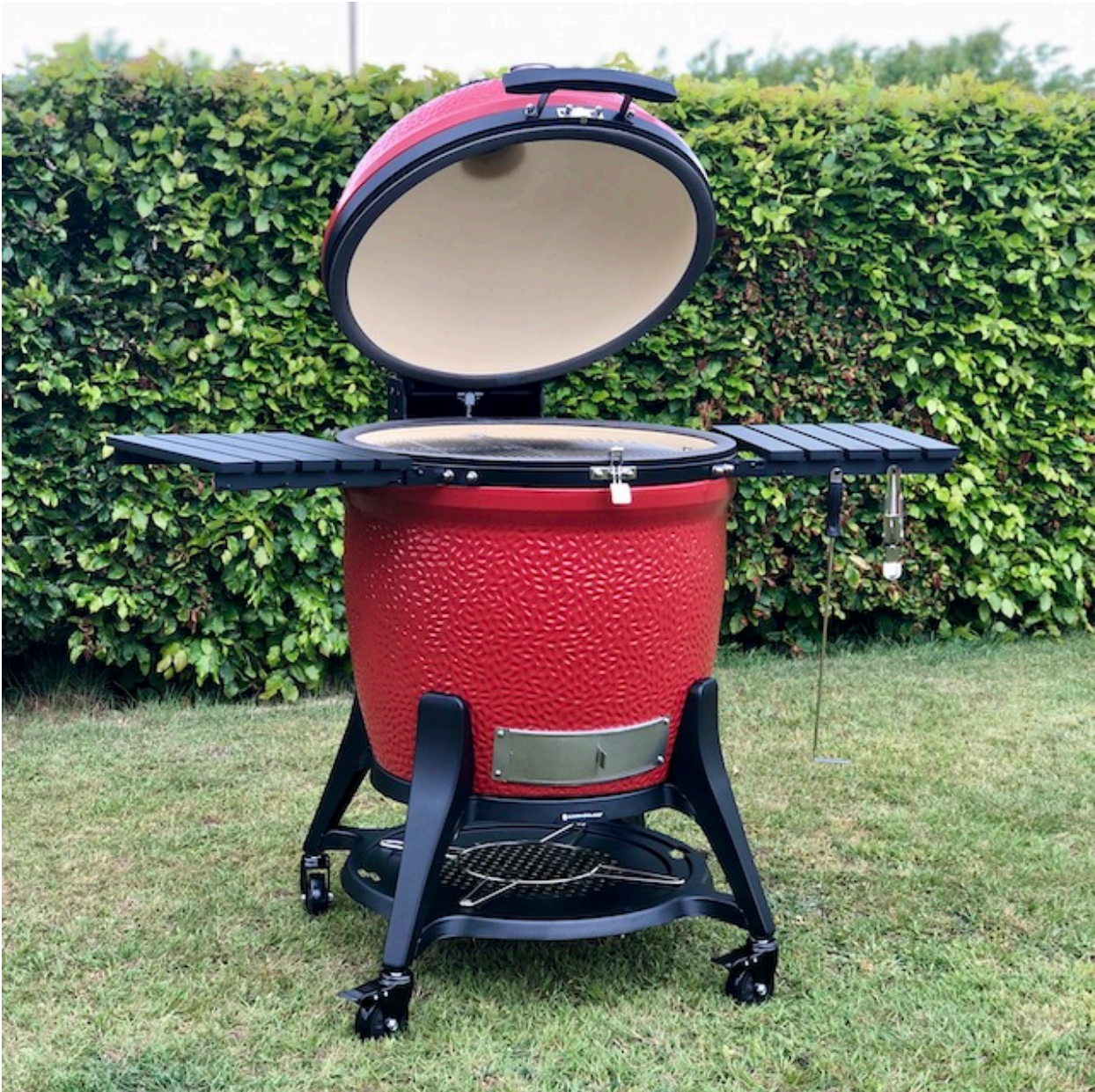
Kamado Joe Big Joe III