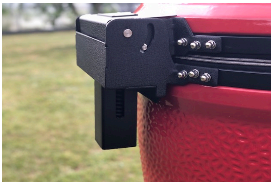
Kamado Joe trykdæmper affjedrings system