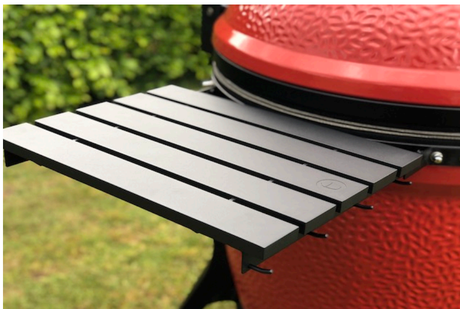
Big Joe 3 Aluminium sidebord