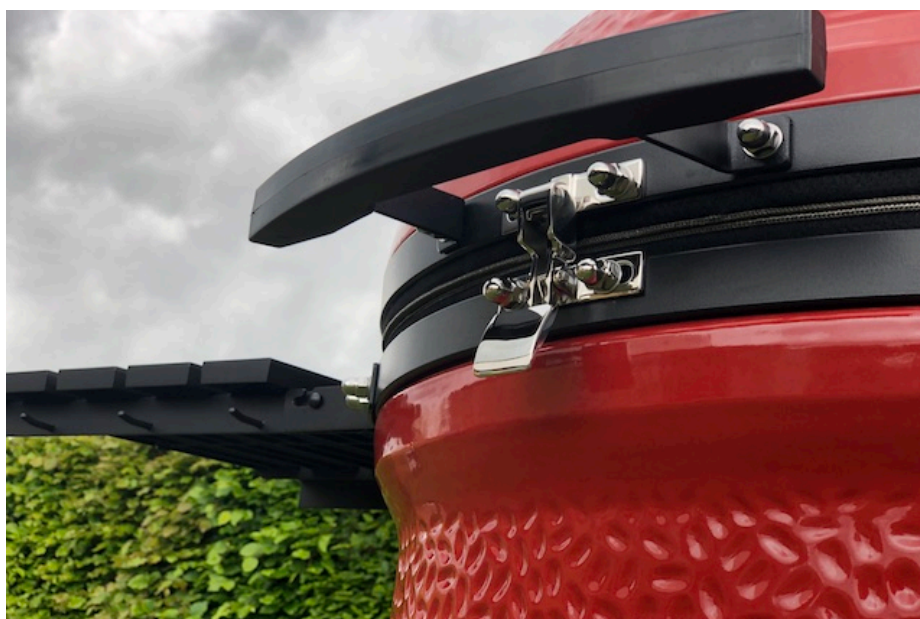
Kamado Joe Låseanordning til låget