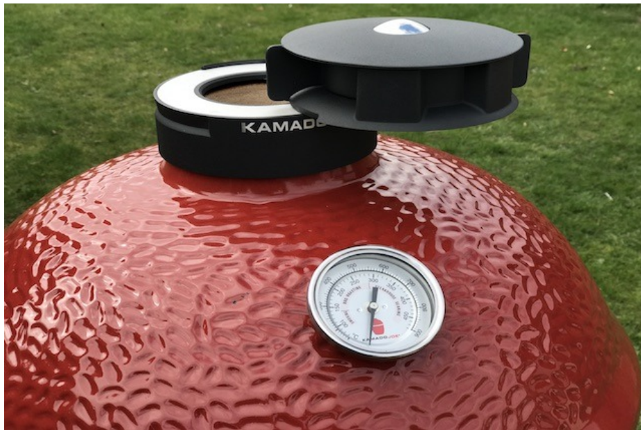
Kamado Joe Top ventilationsventil