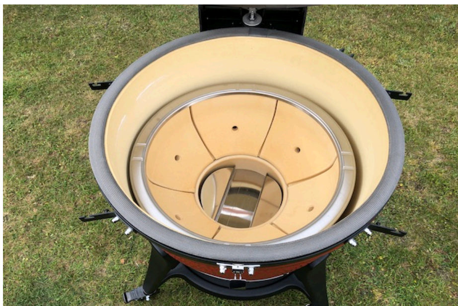
Big Joe 3 Fireboks