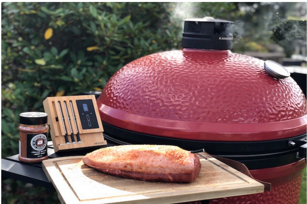
Culottesteg på BigJoe 3

https://boensen.com/kamado-joe-classic-ii-keramikgrill-test/