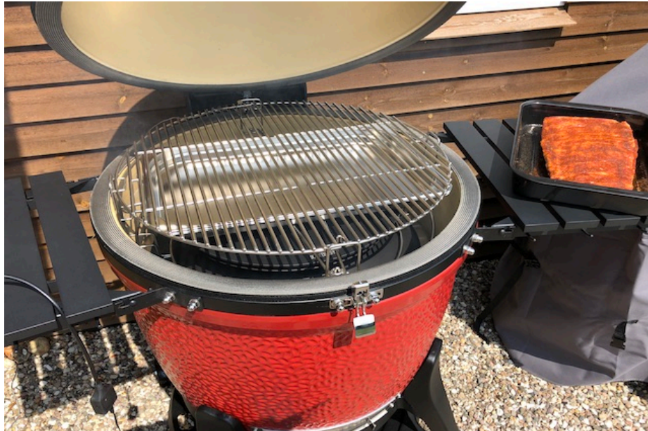
Divide & Conquer grillsystem fra Kamado Joe