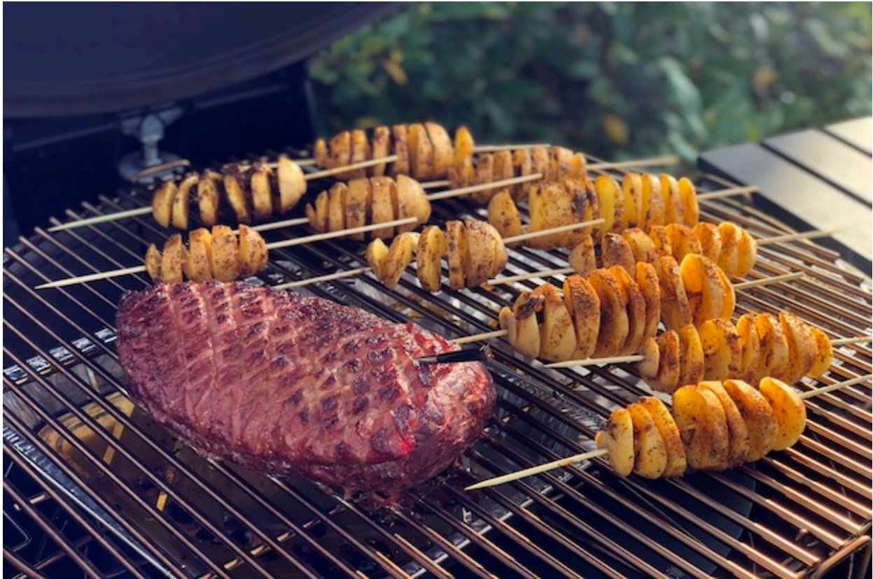
US Culotte med Kartoffel Twister

https://boemsen.com/tornado-kartofler-horny-bacon-kartoffel-twister/