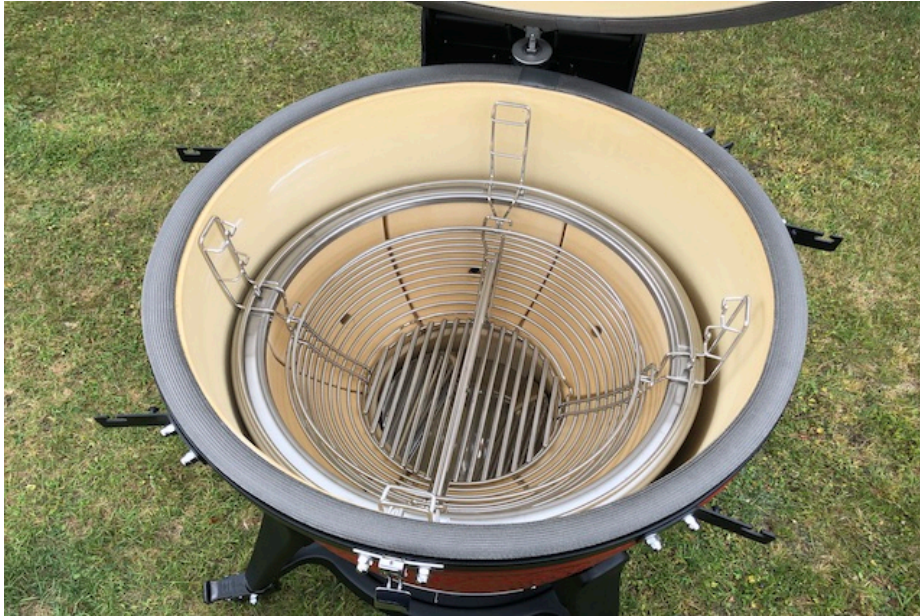
BigJoe III trækulkurv