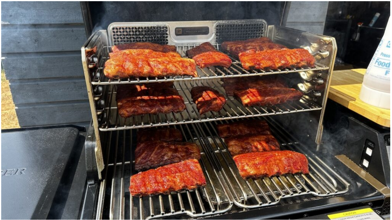
Iberico Sortfodes kamben uden BBQ Sauce efter 6,5 timer på Traeger Timberline L*