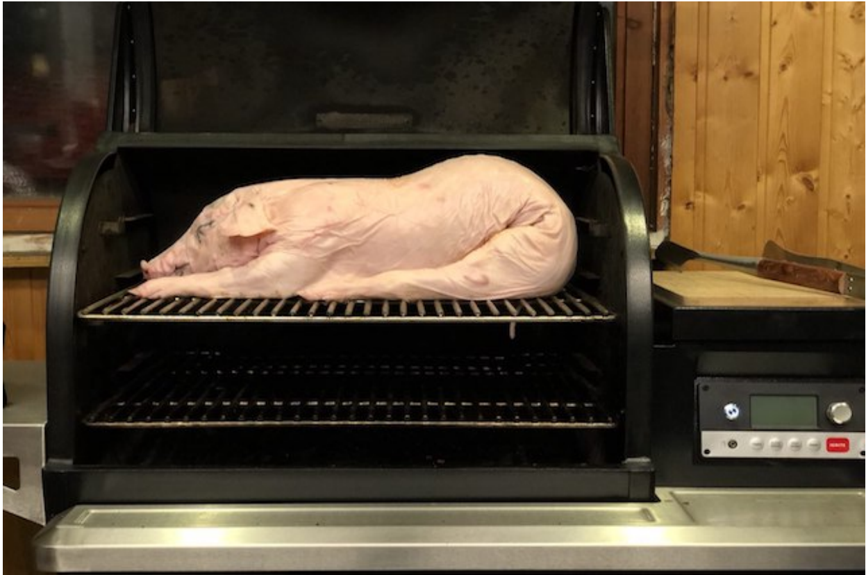
6KG Pattegris prøveligger på min Traeger Timberline