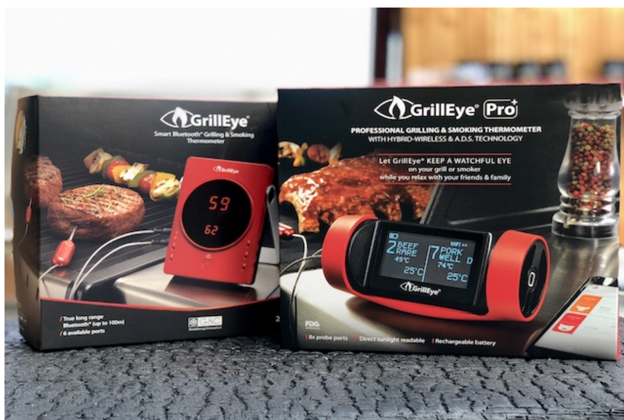
GrillEye & GrillEye Pro Plus

Ved siden af en del forbedringer og forandringer er den største forskelle mellem de to modeller at den ny GrillEye Pro Plus har en Hybrid-Wireless-Connectivity, som betyder at den automatisk skifter mellem din WiFi og Bluetooth netværk derhjemme. Og lige nøjagtigt på grund af denne funktion udnytter du den maksimale rækkevide på denne Grilltermometer. Den ny GrillEye Pro Plus udligner ved hjælp af WiFi den svaghed "rækkevide" af din Bluetooth forbindelse optimalt.