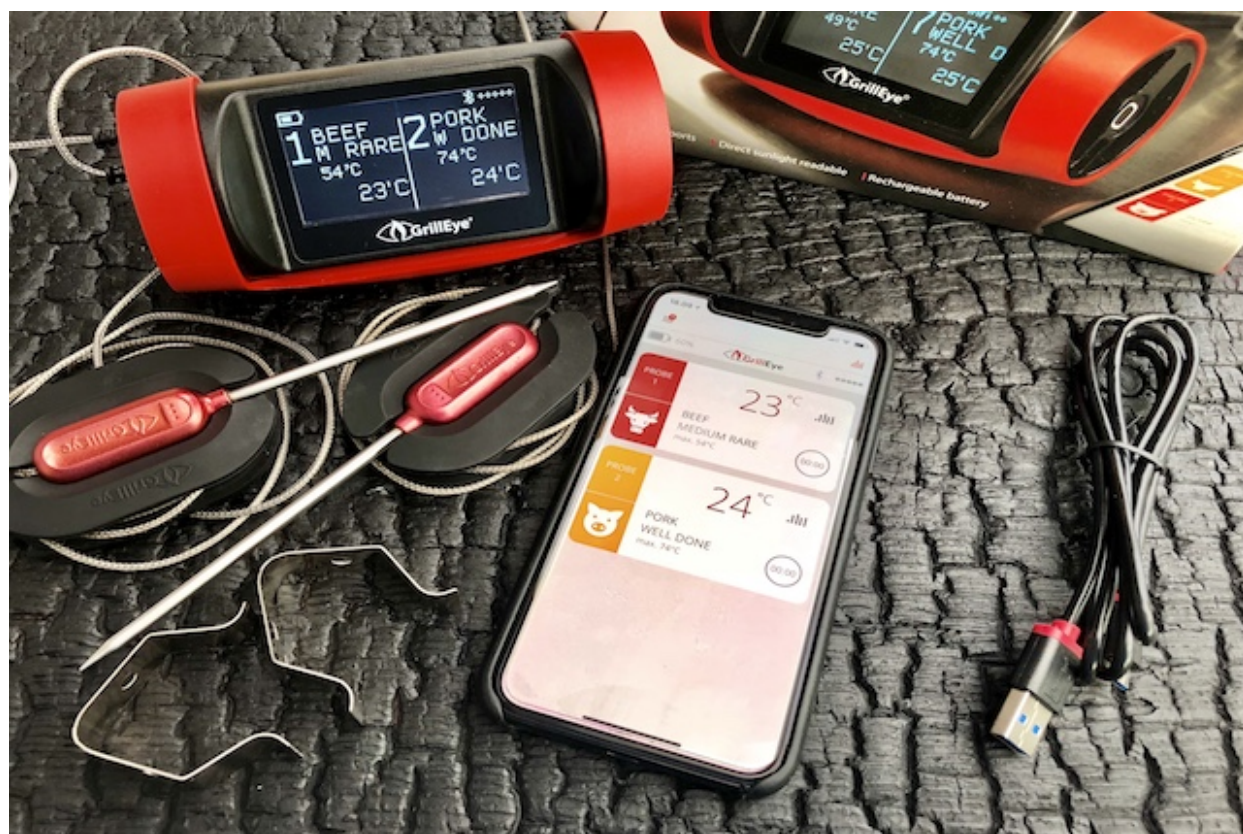
GrillEye Pro Plus

GrillEye Pro Plus Grilltermometer er efterfølgeren til den kendte GrillEye Grilltermometer . GrillEye Pro plus kommer ultimo September til Danmark. Jeg har dog allerede haft fornøjelsen at teste det over de seneste seks uger, stor tak til TBS Grillshop* for det. TBS Grillshop er hovedimportør af GrillEye termometer i Danmark. Om den holder det deres udvikler lover? Kan du læse mere om i denne Grilltermometer test af den nye Grill Eye Pro Plus .