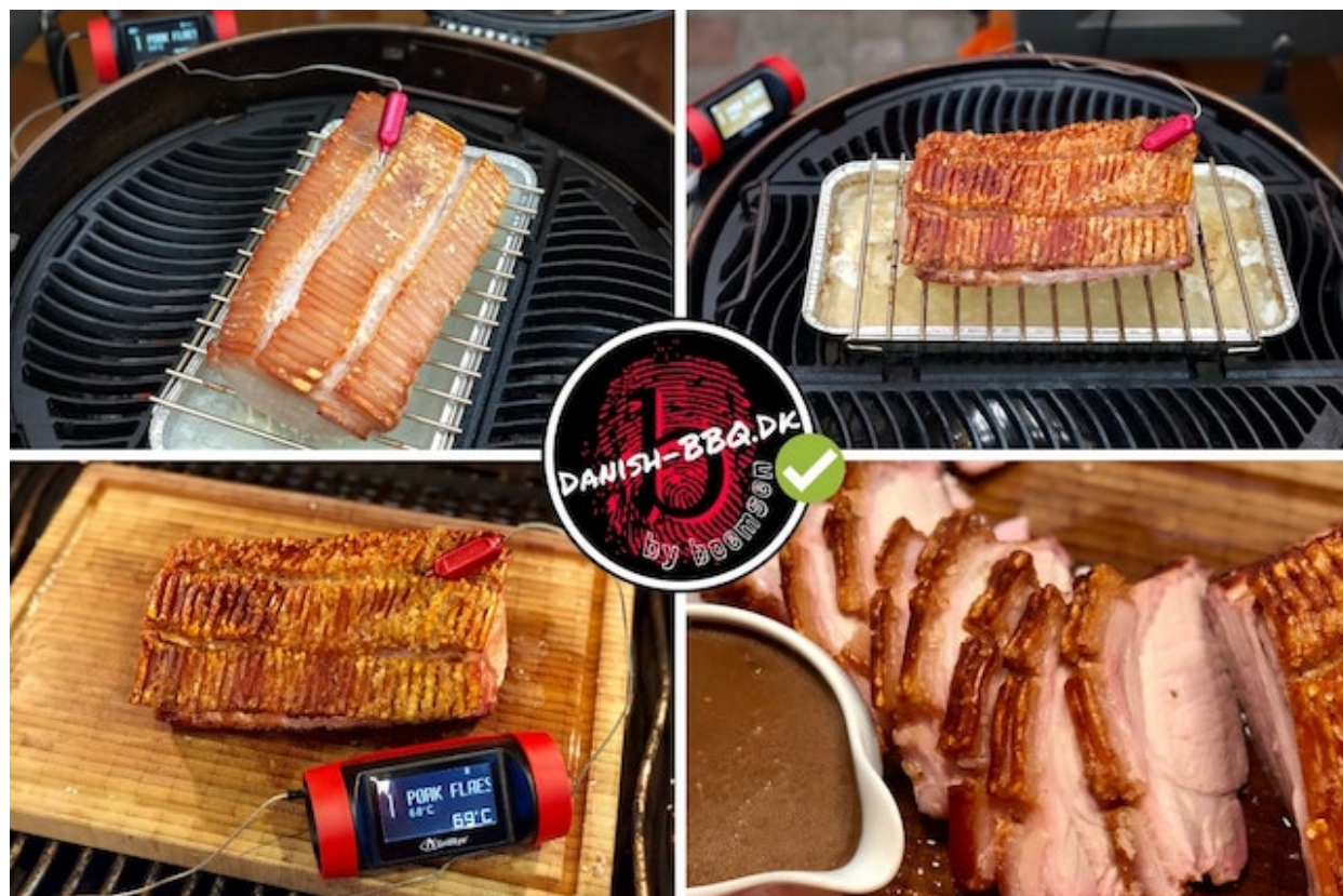
Flæskesteg på Kuglegrill & GrillEye Pro Plus

går og dermed gør den sig diskret bemærkbart.