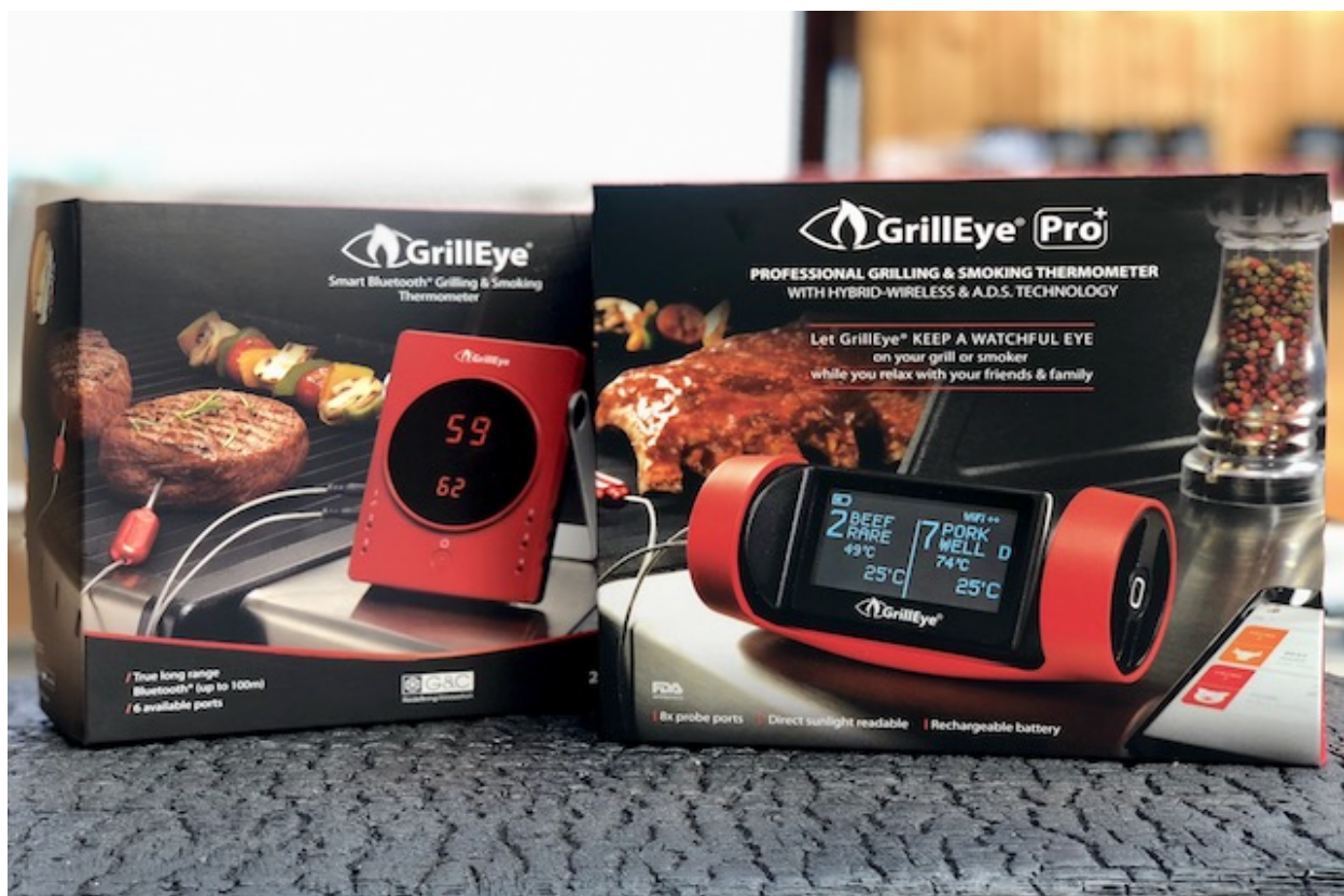
GrillEye & GrillEye Pro Plus

Ved siden af en del forbedringer og forandringer er den største forskelle mellem de to modeller at den ny GrillEye Pro Plus har en Hybrid-Wireless-Connectivity, som betyder at den automatisk skifter mellem din WiFi og Bluetooth netværk derhjemme. Og lige nøjagtigt på grund af denne funktion udnytter du den maksimale rækkevide på denne Grilltermometer. Den ny GrillEye Pro Plus udligner ved hjælp af WiFi den svaghed "rækkevide" af din Bluetooth forbindelse optimalt.