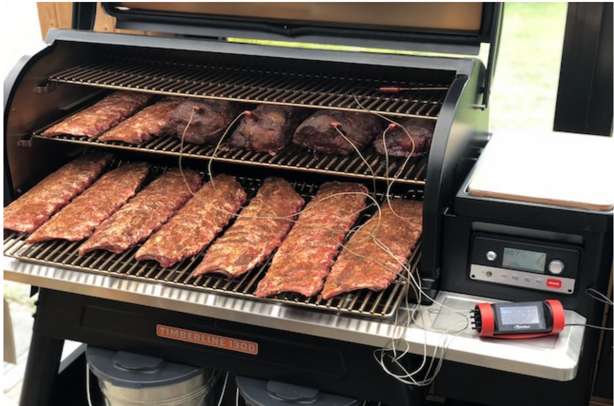
GrillEye Pro Plus & Pulled Pork på Traeger Timberline 1300