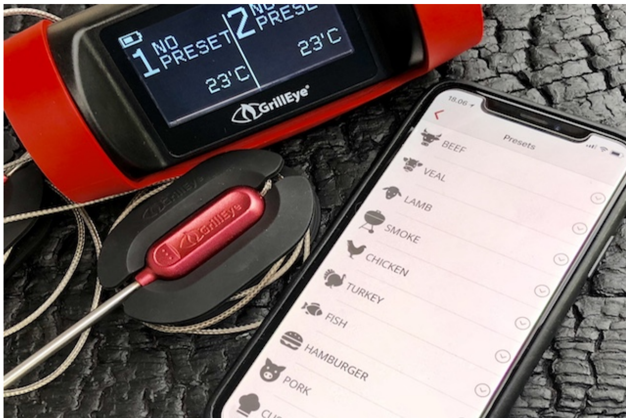
Forudindstillede temperaturer - GrillEye Pro Plus

For hver type kød også fisk er der forudindstillede madlavningstemperaturer, som garanter at du altid rammer den rigtige kernetemperaturer. Disse kan suppleres og omprogrammeres efter dine egne præferencer. Du kan også indtaste dine egne temperaturer under punktet "CUSTOM", som også kan vises som en temperaturkurve i en graf.