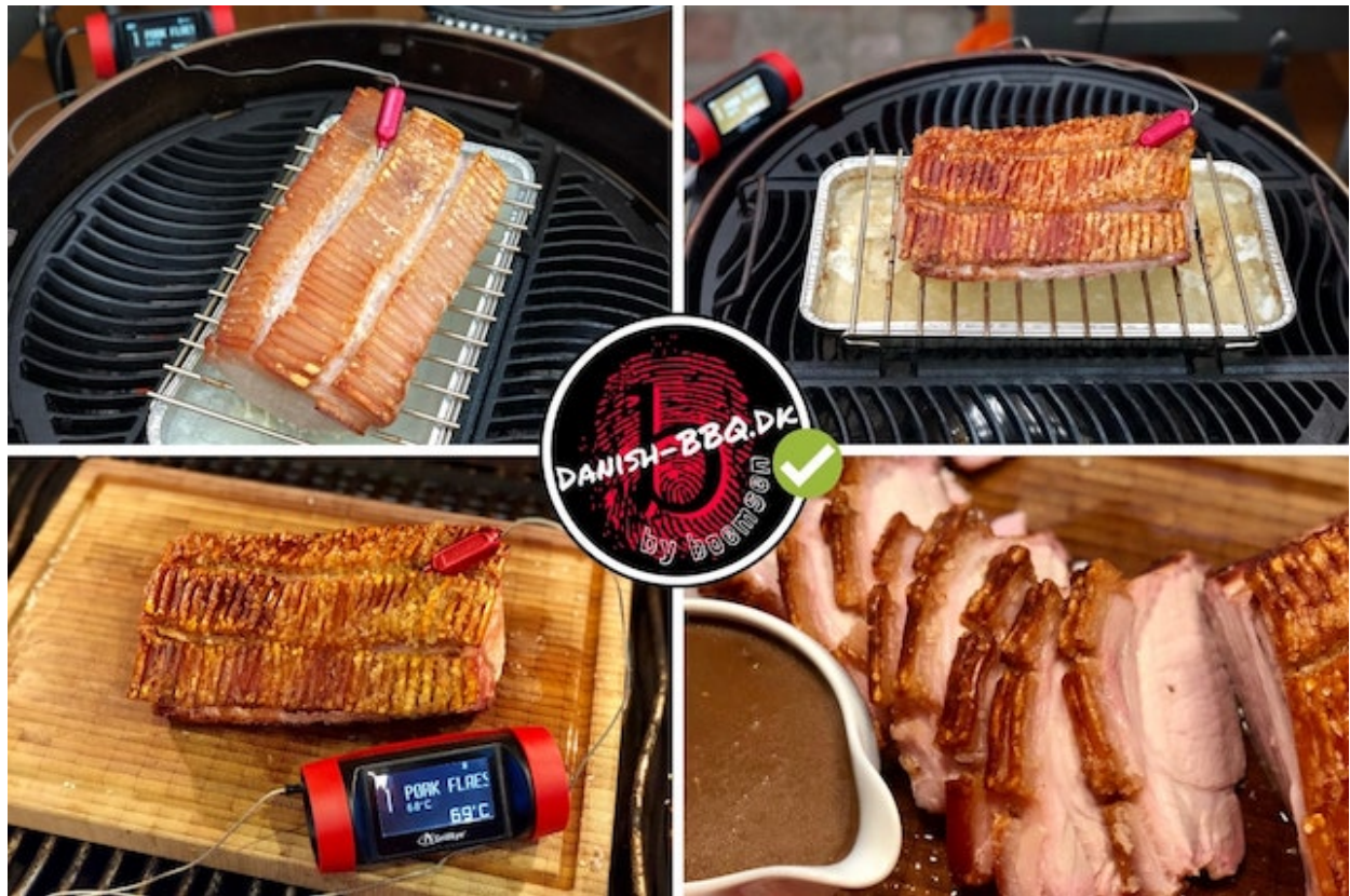
Flæskesteg på Kuglegrill & GrillEye Pro Plus

går og dermed gør den sig diskret bemærkbart.