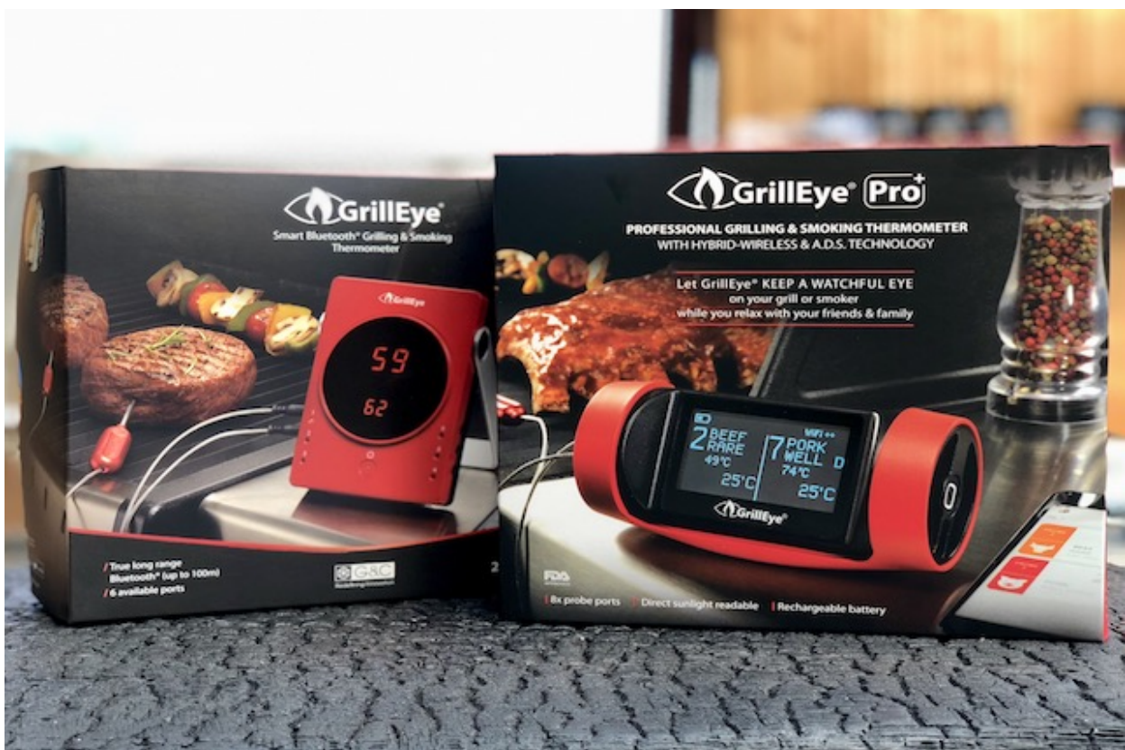
GrillEye & GrillEye Pro Plus

Ved siden af en del forbedringer og forandringer er den største forskelle mellem de to modeller at den ny GrillEye Pro Plus har en Hybrid-Wireless-Connectivity, som betyder at den automatisk skifter mellem din WiFi og Bluetooth netværk derhjemme. Og lige nøjagtigt på grund af denne funktion udnytter du den maksimale rækkevide på denne Grilltermometer. Den ny GrillEye Pro Plus udligner ved hjælp af WiFi den svaghed "rækkevide" af din Bluetooth forbindelse optimalt.