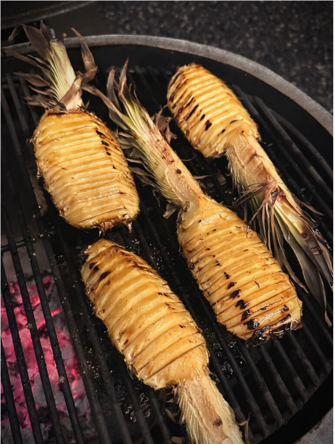
Gylden Ananas Grill dessert med en fantastisk smag af