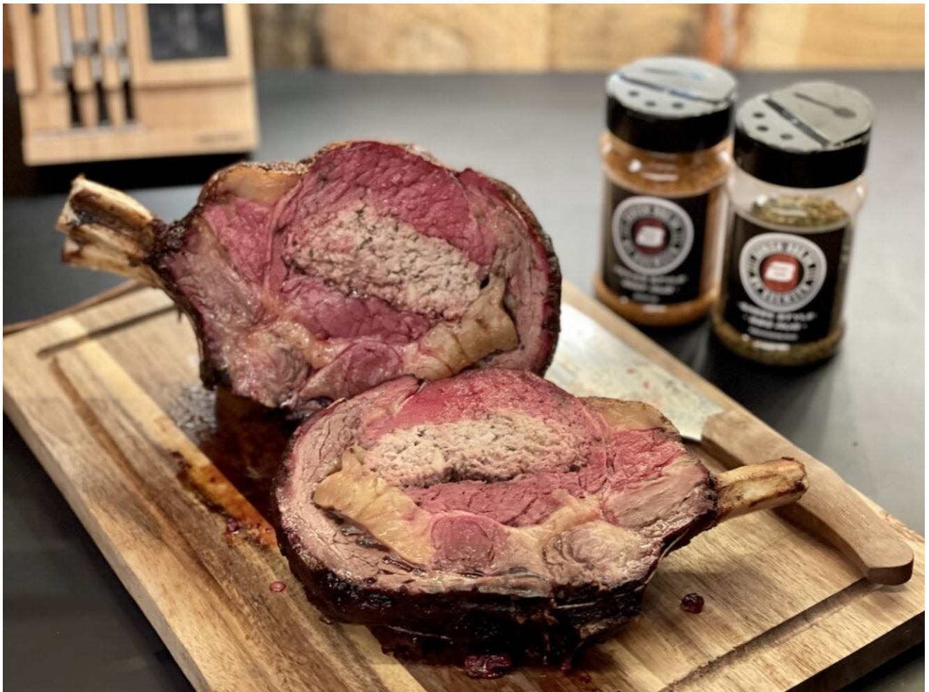
Cuberoll skåret ud og serveret med sødkartofler og hollandaise sauce