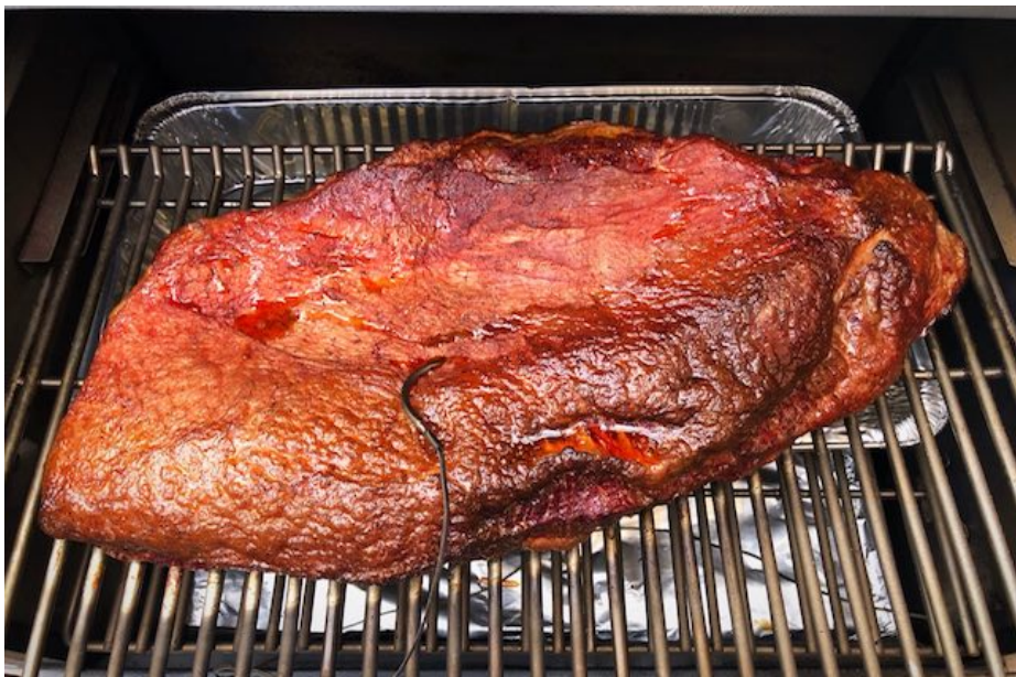
Full Packer Beef Brisket efter 4 timer, ved 80 grader og Hickory Røg