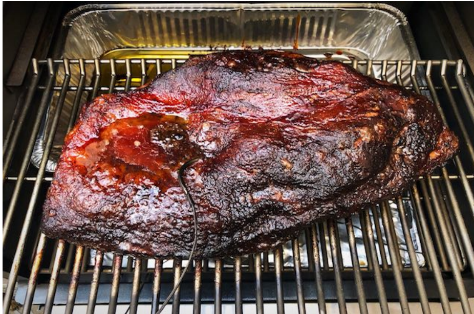
Full Packer Beef Brisket efter 12 timer, kernetemperatur på 80 grader