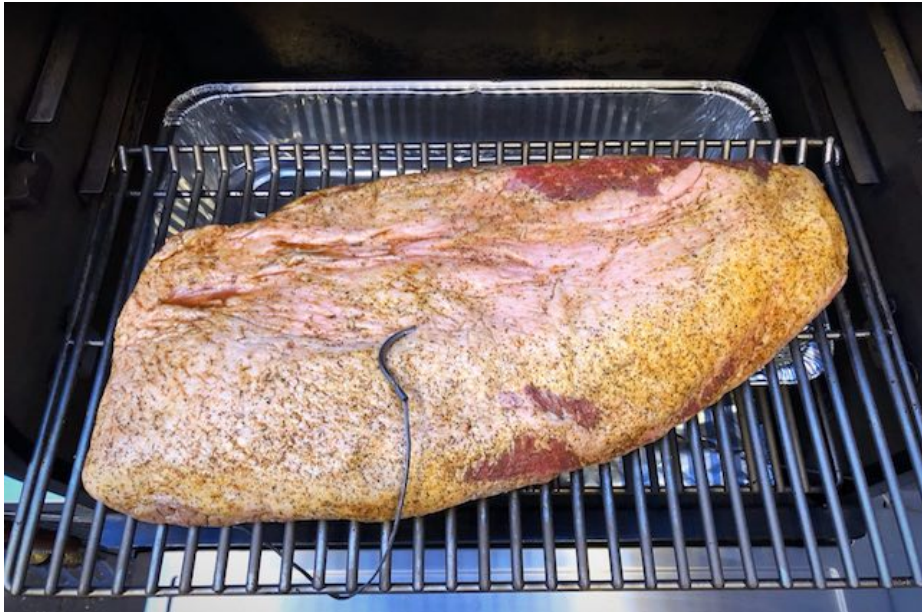
Full Packer Beef Brisket