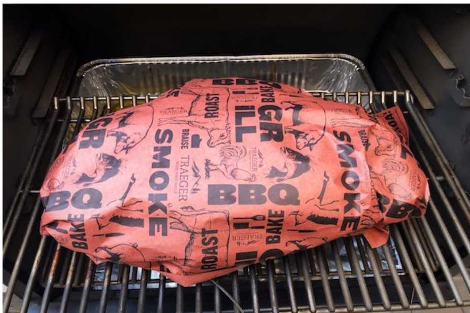
Full Packer Beef Brisket efter 12 timer, pakket i Slagterpapir