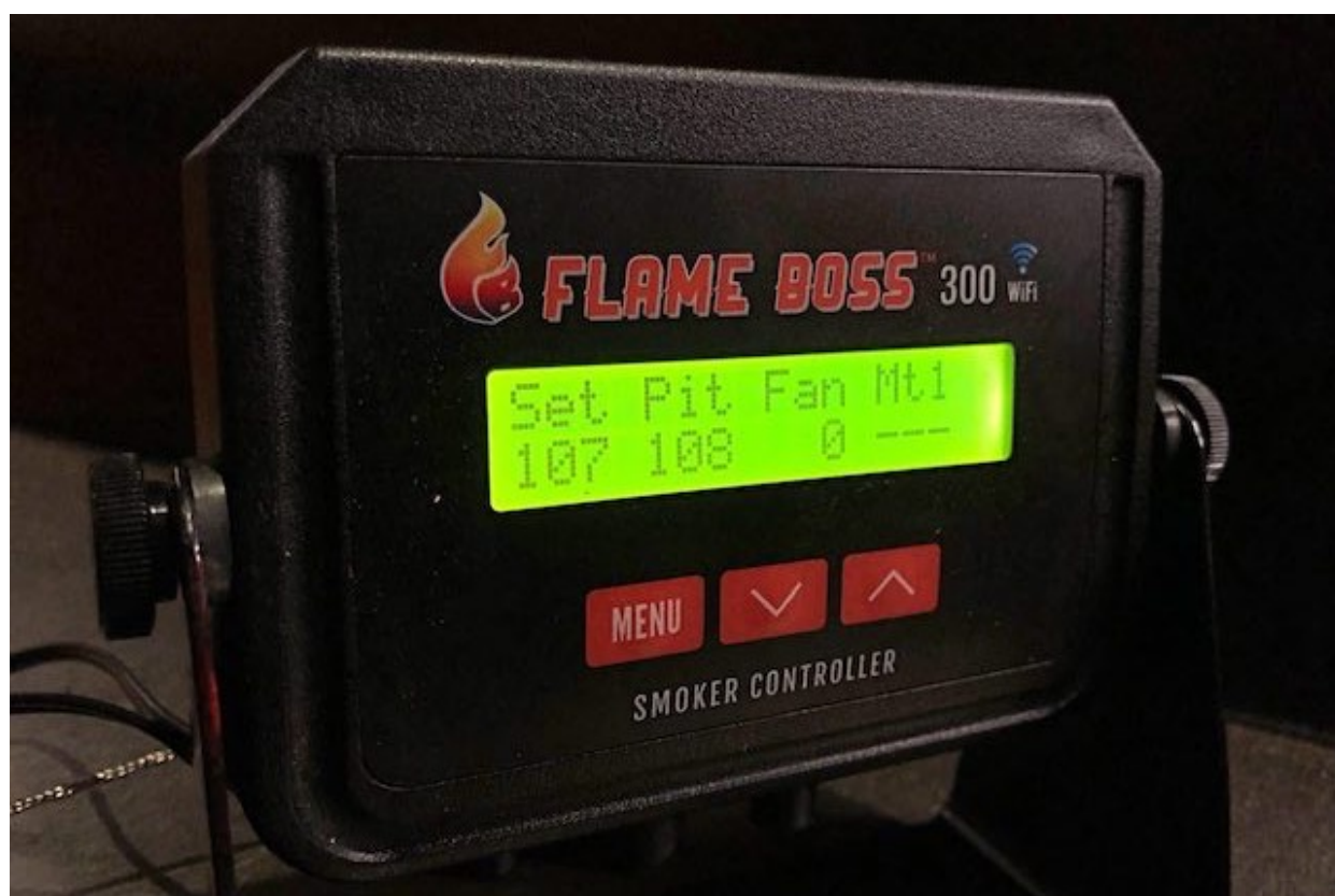
Flame Boss 300 WiFi

Flame Boss 300 er nogle jeg som en ægte backyard-griller har ventet længe på! En rigtig Wifi termometer og temperatur controller blev forenet i et. Dette skete i efterår 2017. Jeg har faktisk også lige siden haft min Flame Boss 300. Du spørger dig sikkert hvad det er, og hvad den er god til. Det vil jeg gerne komme lidt mere ind på.