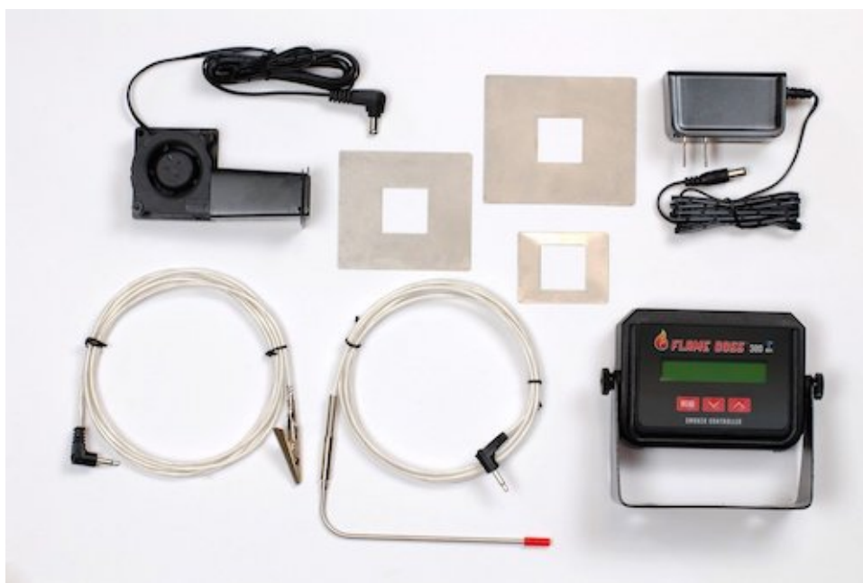
Flame Boss Kamado Kit

Den leveres med 1 temperatur probe til kød og 1 temperatur probe for at overvåge temperaturen i grillen eller smokeren. Der er også en lille blæser og tre adapterplader med. Som sørger for dette Flame Boss Kamado Kit passer til de fleste Kamado grills på marked. Her er blot et udpluk af de mærker hvor de adapter passer. Big Green Egg, Kamado Joe, Primo Grills, Safire Grill & Smoker, Grill Dome, Vision Grills Classic, Broil King Keg - 2000 & 4000, Char-Griller AKORN Kamado.