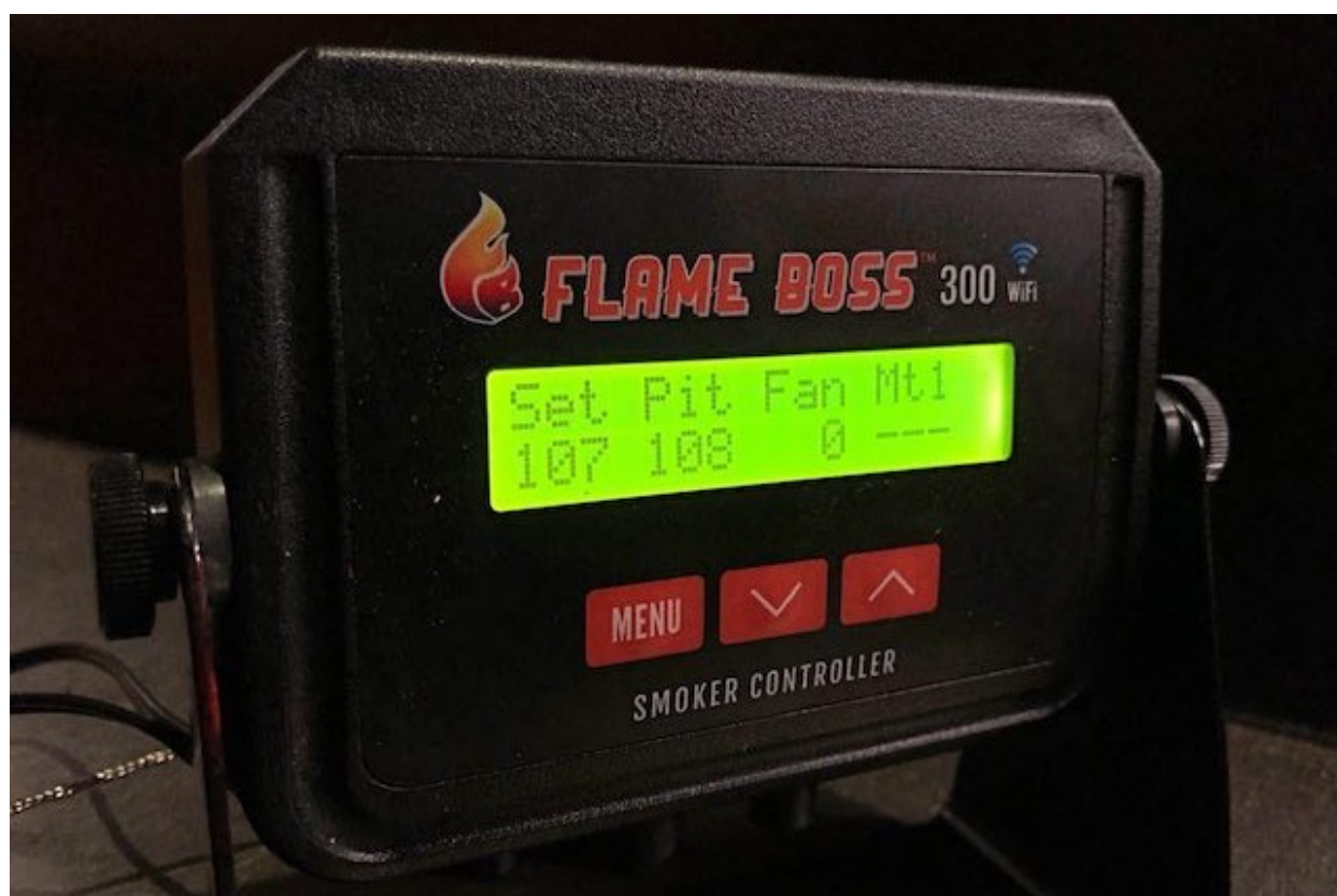
Flame Boss 300 WiFi

Flame Boss 300 er nogle jeg som en ægte backyard-griller har ventet længe på! En rigtig Wifi termometer og temperatur controller blev forenet i et. Dette skete i efterår 2017. Jeg har faktisk også lige siden haft min Flame Boss 300. Du spørger dig sikkert hvad det er, og hvad den er god til. Det vil jeg gerne komme lidt mere ind på.