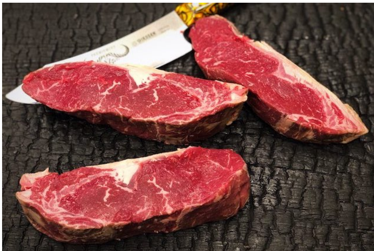
Striplion udskåret til 4x 450g Entrecote

En Entrecoten vejer normalt mellem 350 og 550 gram. Dog burde du skære dem med en minimums tykkelse på 3 centimeter og en vægt fra ca. 300 g er almindelig. Jeg fortrækker dog den lidt mere blærerøvsudskæring af 450 til 550 gram. For hvis man har sådan et stykke kød som en Entrecote skal man nyde kødet og ikke alt det der skal spises til. Nyde kødet som det er uden alt fancy tilbehør.