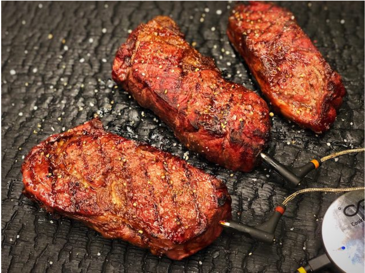
Entrecote frisk fra Grillen med Flagesalt og Frisk kværnet Peber