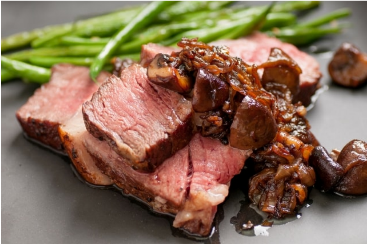
Serveringsforslag Entrecote med Marinerede Svampe

Som tilbehør vil jeg anbefale du prøver marinerede svampe direkte fra grillen.