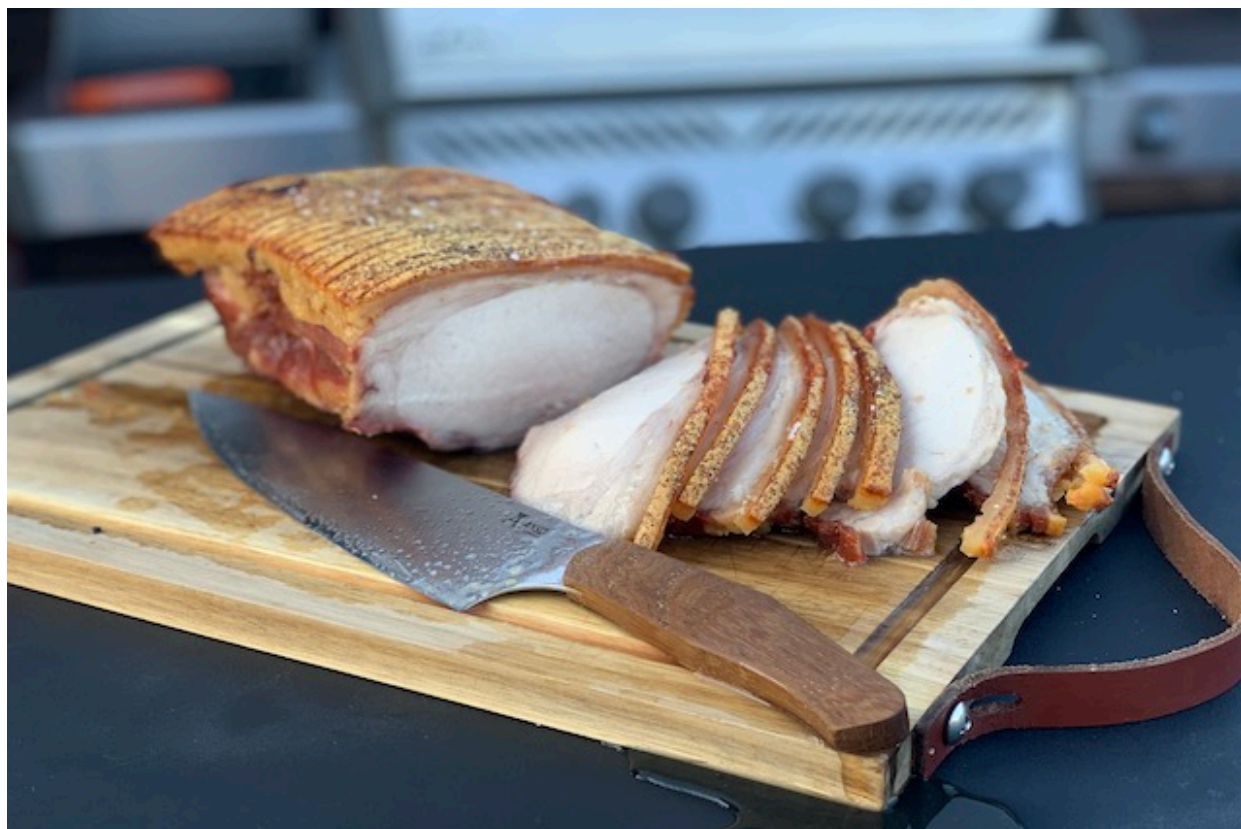
Krogmodet Flæskesteg tilberedt på Napoleon Rogue 525SE klar til servering

forberedelsestid ca. 20min. tilberedningstid: ca. 2 -2,5 timer.