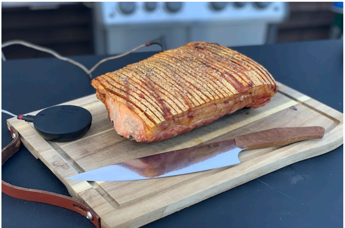
Krogmodet Flæsketeg hviler 15 min på spækbræt