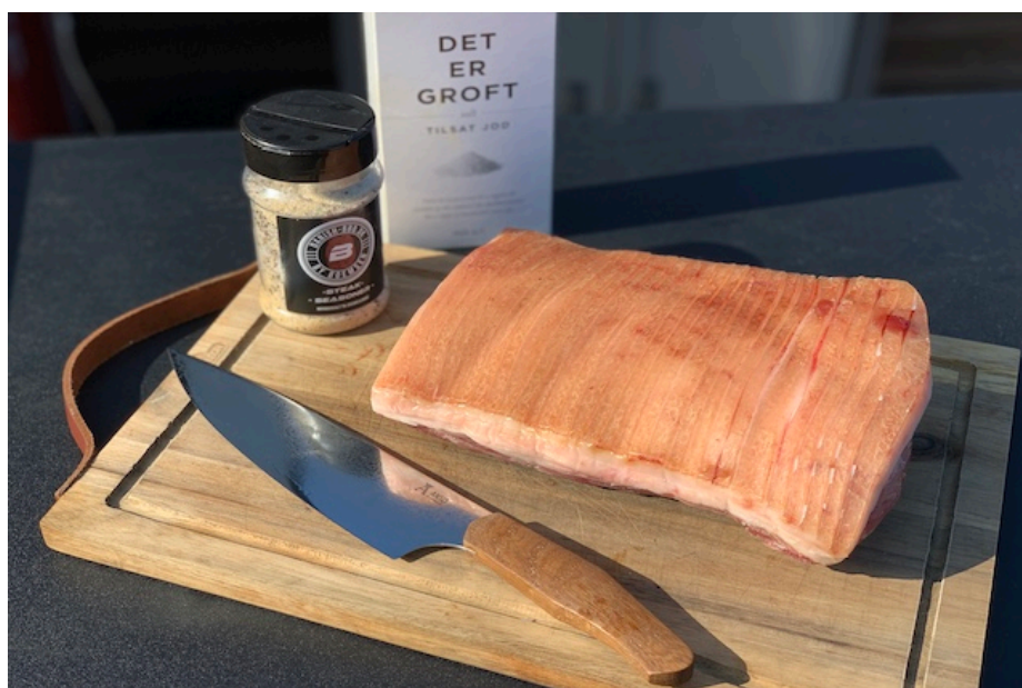
Dry Aged Flæskesteg