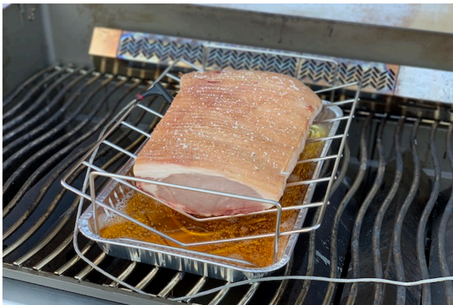
Dryaged Flæskesteg i stegholder over mørk øl