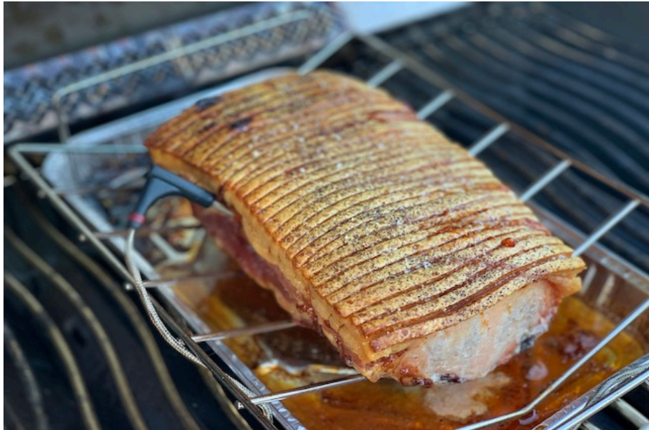
Den færdig grillede Flæsketeg på Napoleon Rogue 525SE