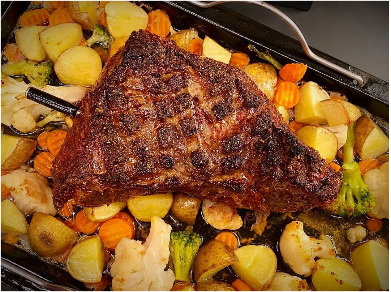
US Cuvette i fad med blandet grønt klar til servering