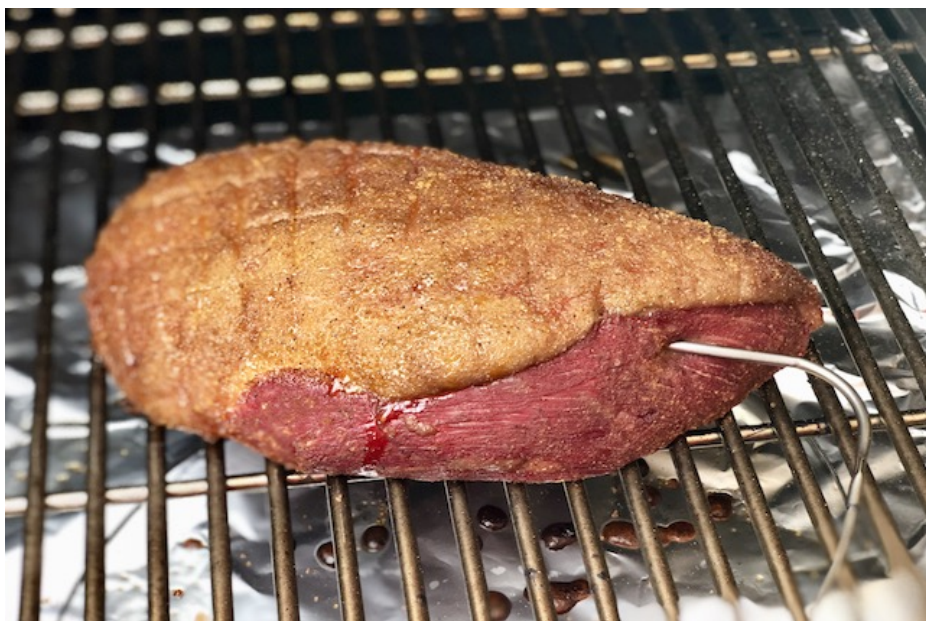
Culotten efter 60 min. på Traeger Timberline 850