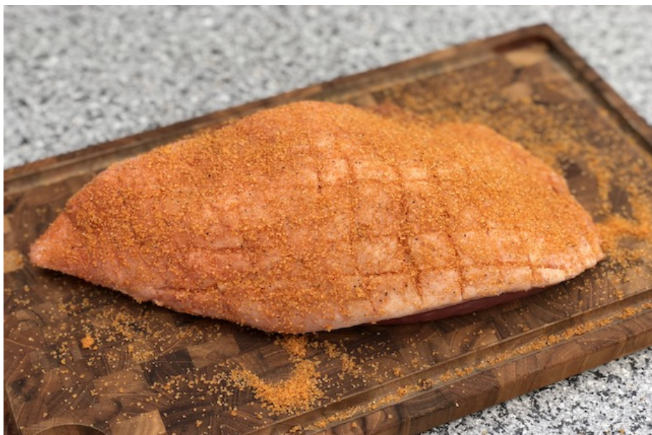
Culotte påført BBQ RUB