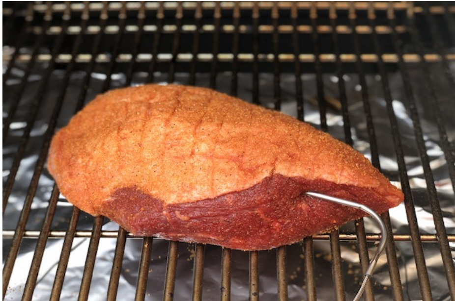
Culotte på Traeger Timberline 850