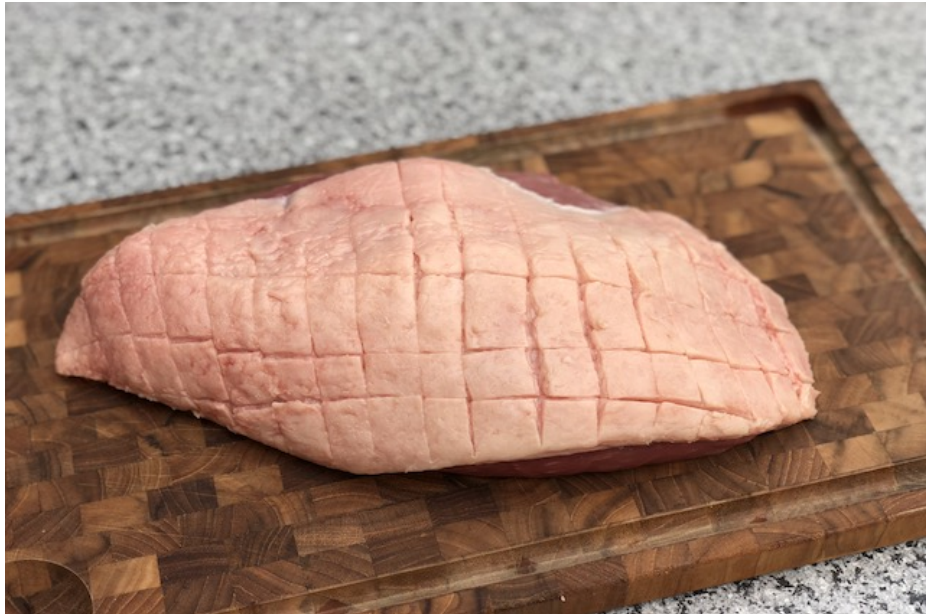
Culotte ridset og klar til tiberedning