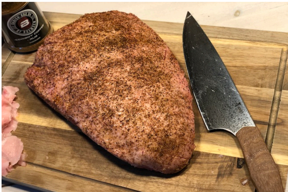
Cowboy Coffe Culottesteg med Njord kokkekniv*