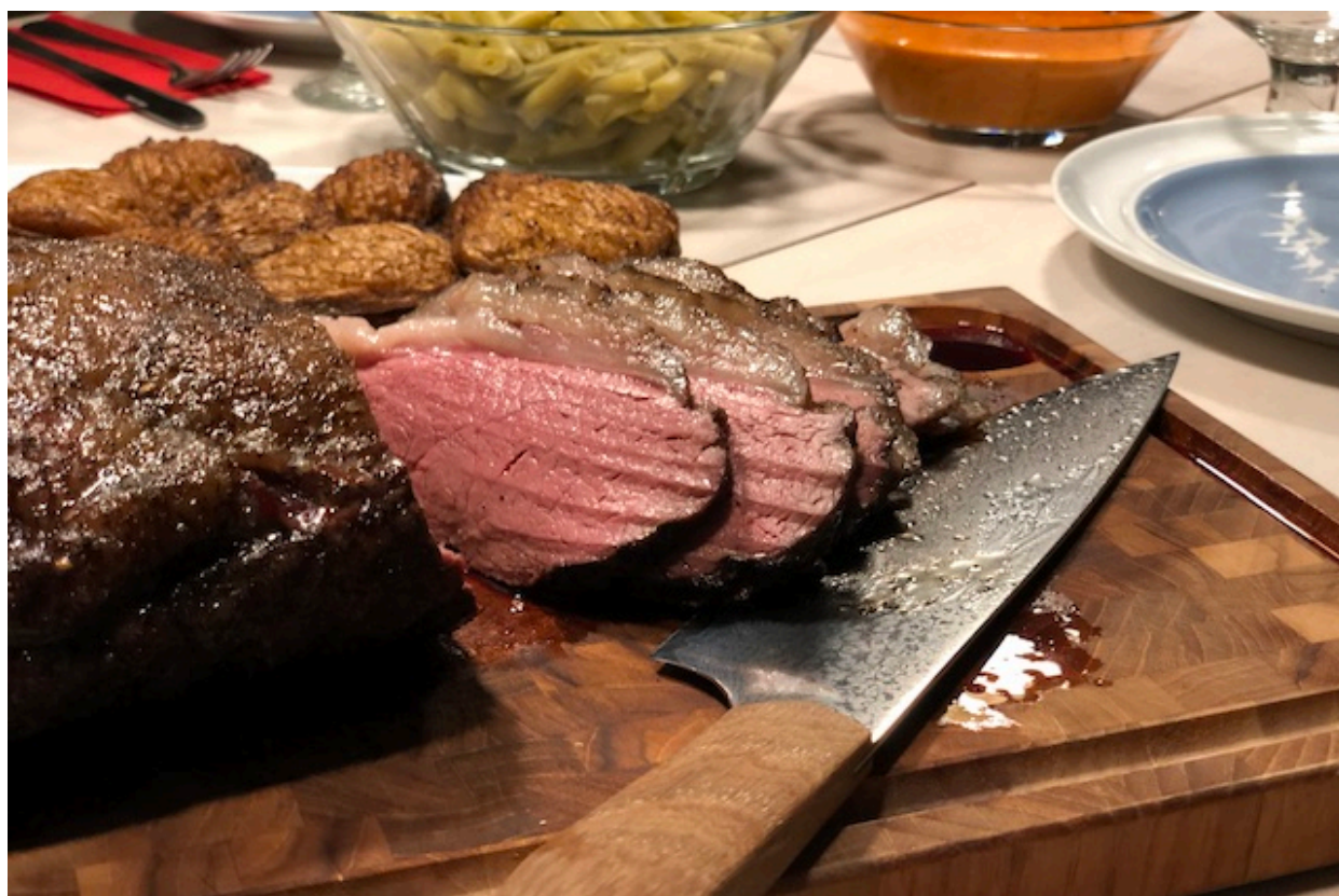
Cowboy Coffe Culottesteg med Horny Bacon Kartoffler

forberedelsestid ca. 20min. tilberedningstid: ca. 2 til 2,5 timer.