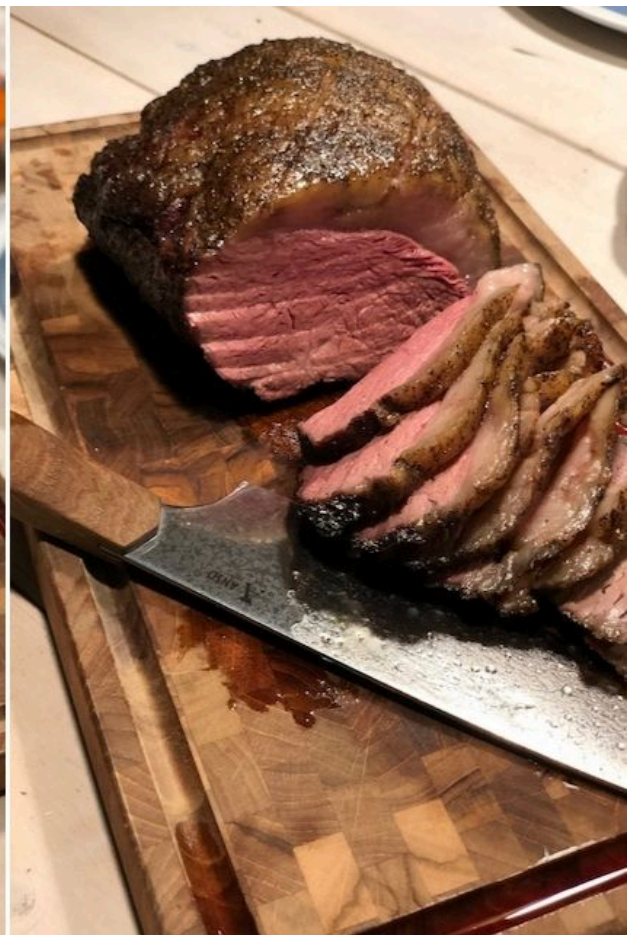
Cowboy Coffee Culotte steg