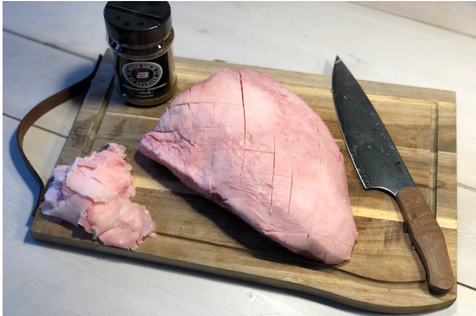
Trimmet Culottesteg med Njord kokkekniv*