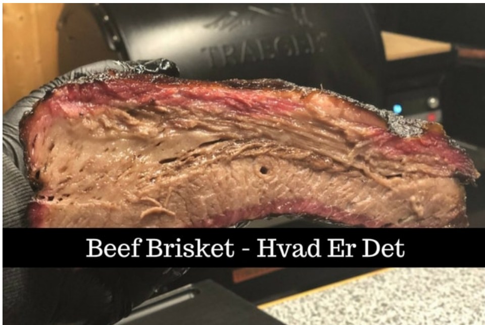
Beef Brisket - Hvad Er Det