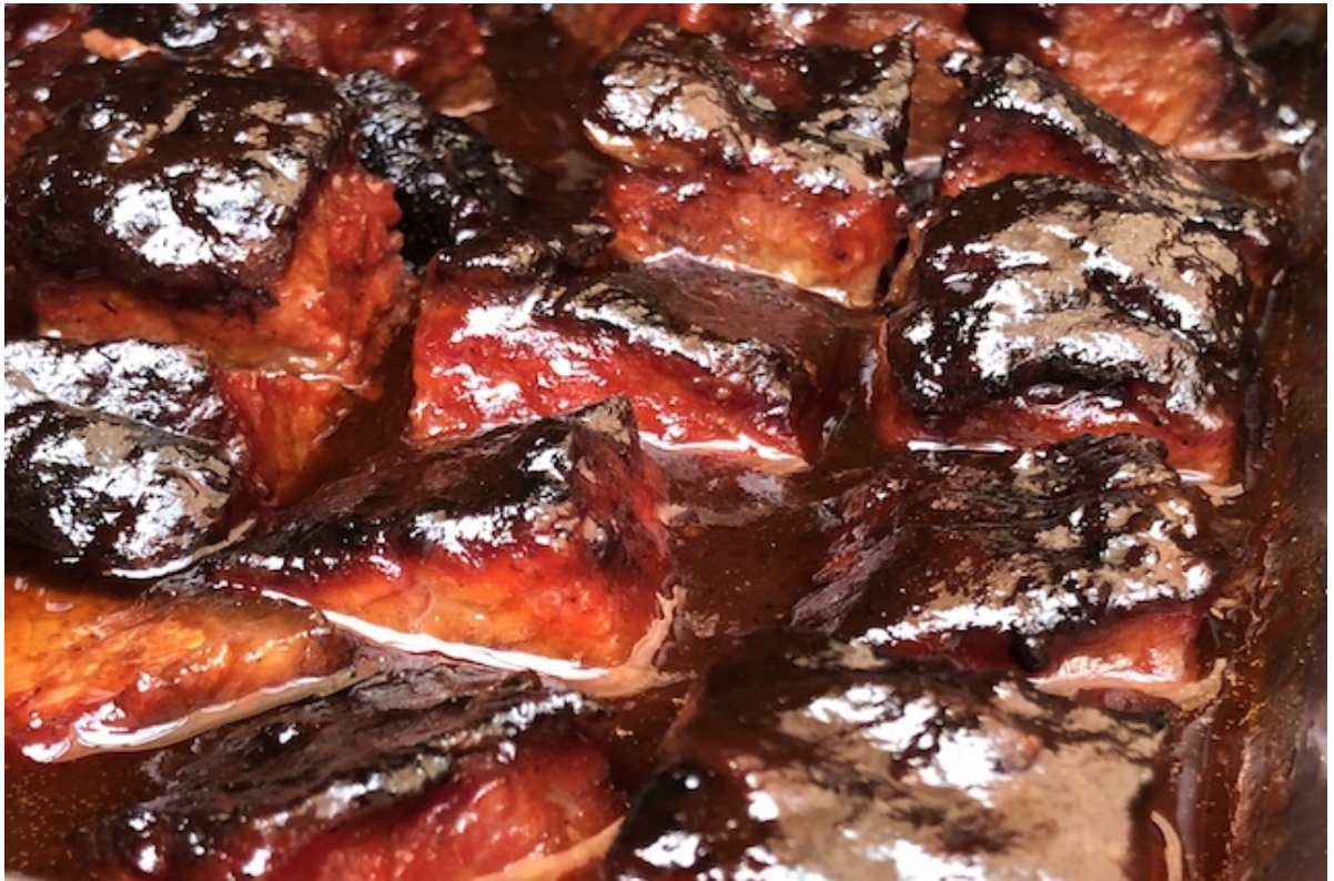
Brisket Burnt Ends - gudernes Slik

Nu er det på tid til det sidste kys af røg og varme på Grillen. Den her proces skal gå stærkt meget stærkt for ellers begynder dine Burnt Ends at køle ud og din Sauce og Brun Farin begynder at størkne. Skynd dig at kom dine Brisket Burnt Ends tilbage på Grillen i yderligere 1-2 timer. Eller indtil Saucen på dine Burnt Ends er karamelliseret og de er lige ved at falde fra hinanden.