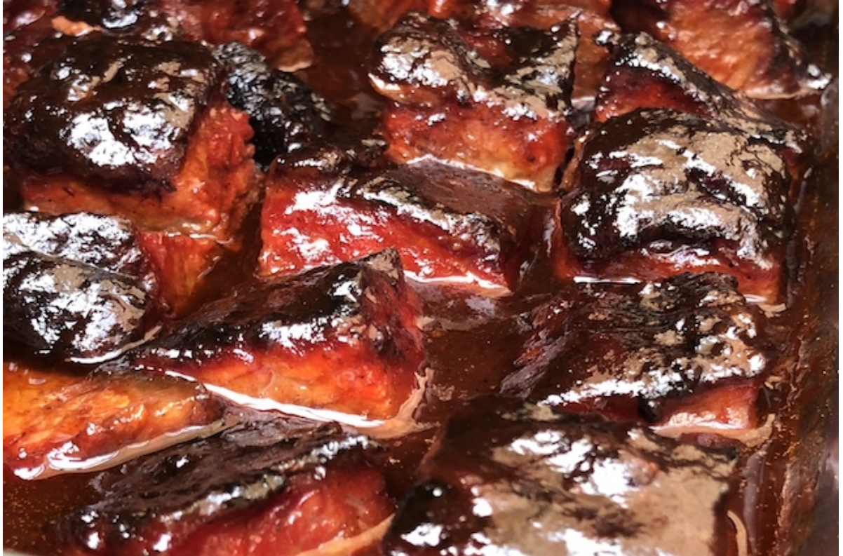
Brisket Burnt Ends - gudernes Slik

Nu er det på tid til det sidste kys af røg og varme på Grillen. Den her proces skal gå stærkt meget stærkt for ellers begynder dine Burnt Ends at køle ud og din Sauce og Brun Farin begynder at størkne. Skynd dig at kom dine Brisket Burnt Ends tilbage på Grillen i yderligere 1-2 timer. Eller indtil Saucen på dine Burnt Ends er karamelliseret og de er lige ved at falde fra hinanden.