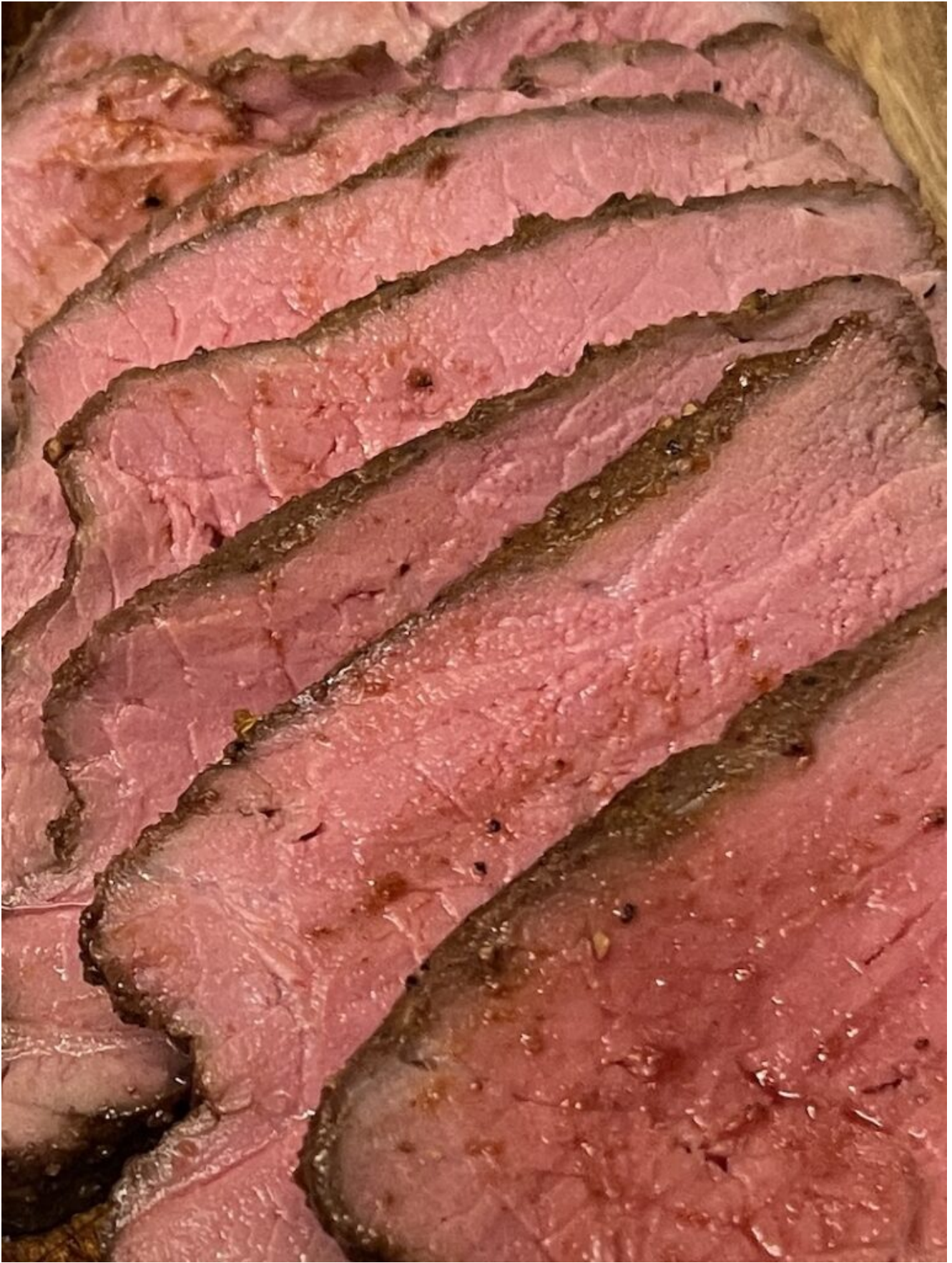
Rigtigt Udskæring mod Fiberne